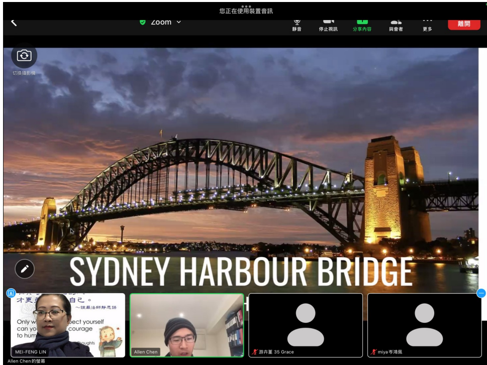
澳洲慈濟人文學校校長與志工學生線上培訓、主題三：當地著名景點介紹