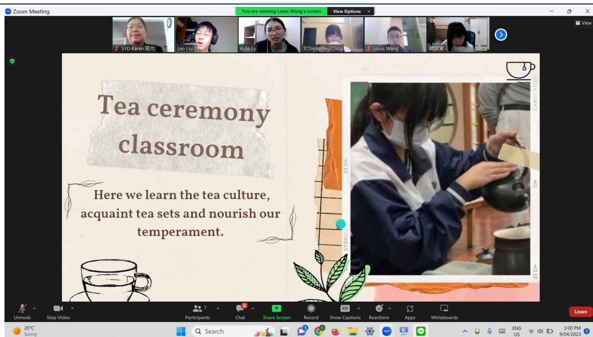
澳洲慈濟人文學校老師與志工學生線上培訓，主題一：我的校園生活