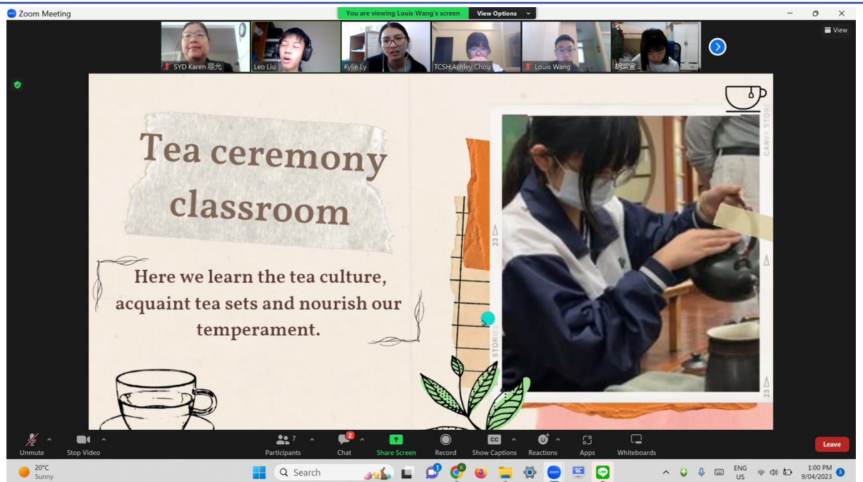
澳洲慈濟人文學校老師與志工學生線上培訓，主題一：我的校園生活