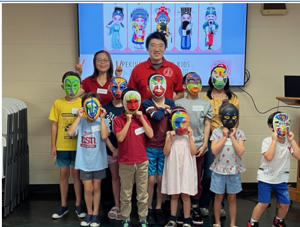
學員製作創意臉譜