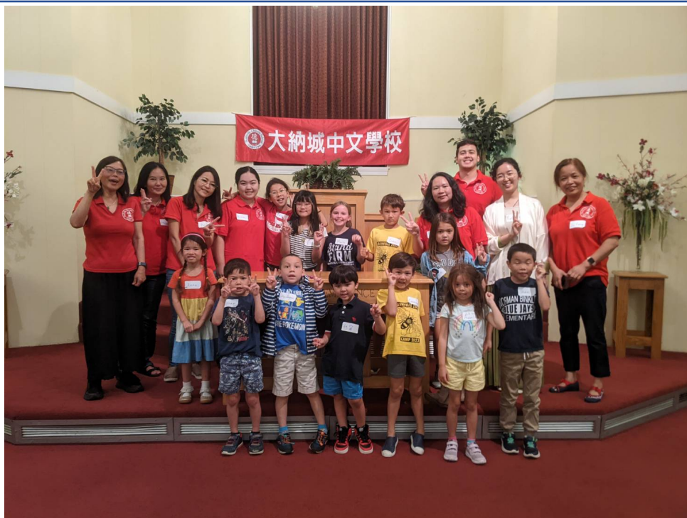
大納城中文學校夏令營，學員收穫滿滿