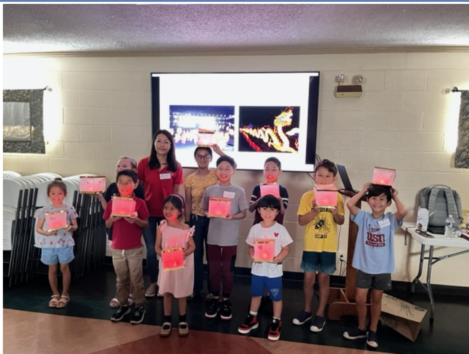
蘊含祝福的水燈製作