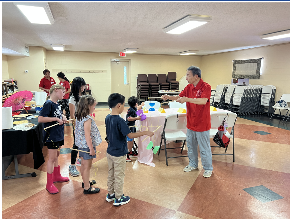
傳統技藝扯鈴課程，學員們個個聚精會神