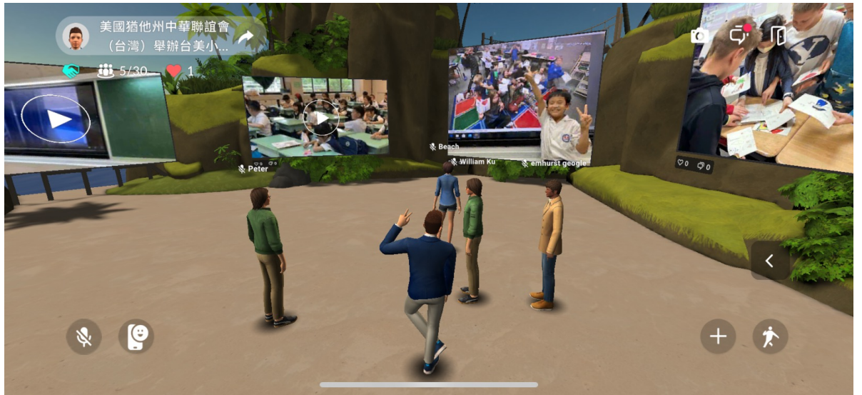
Draper Elementary School與臺北市再興小學學生交流作品(卡片與影片)GOXR元宇宙展場