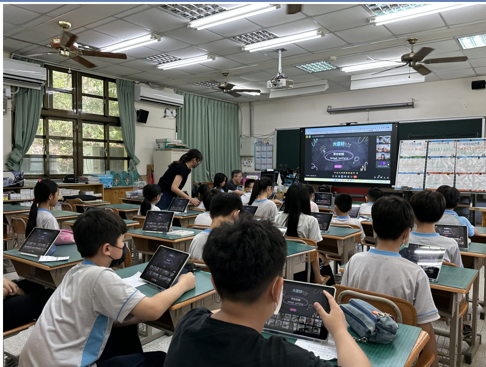
南投縣延平國小與鳳興書院「校園生活」交流現場實況