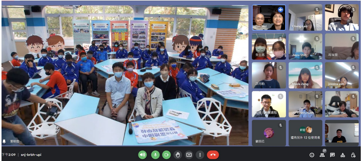
鳳興書院與新竹市富禮國中線上交流合影