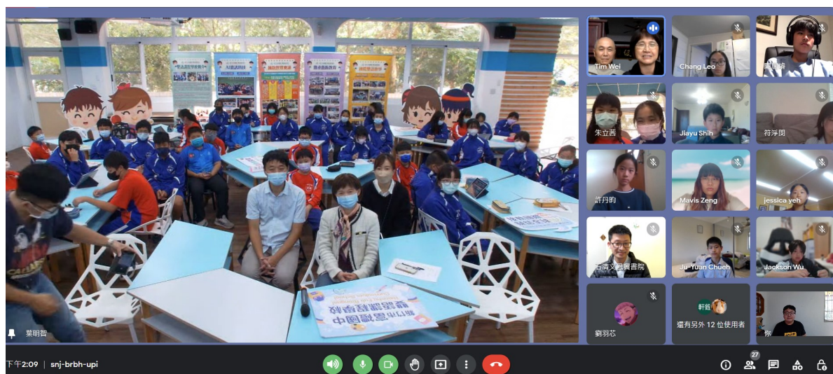
鳳興書院與新竹市富禮國中線上交流合影