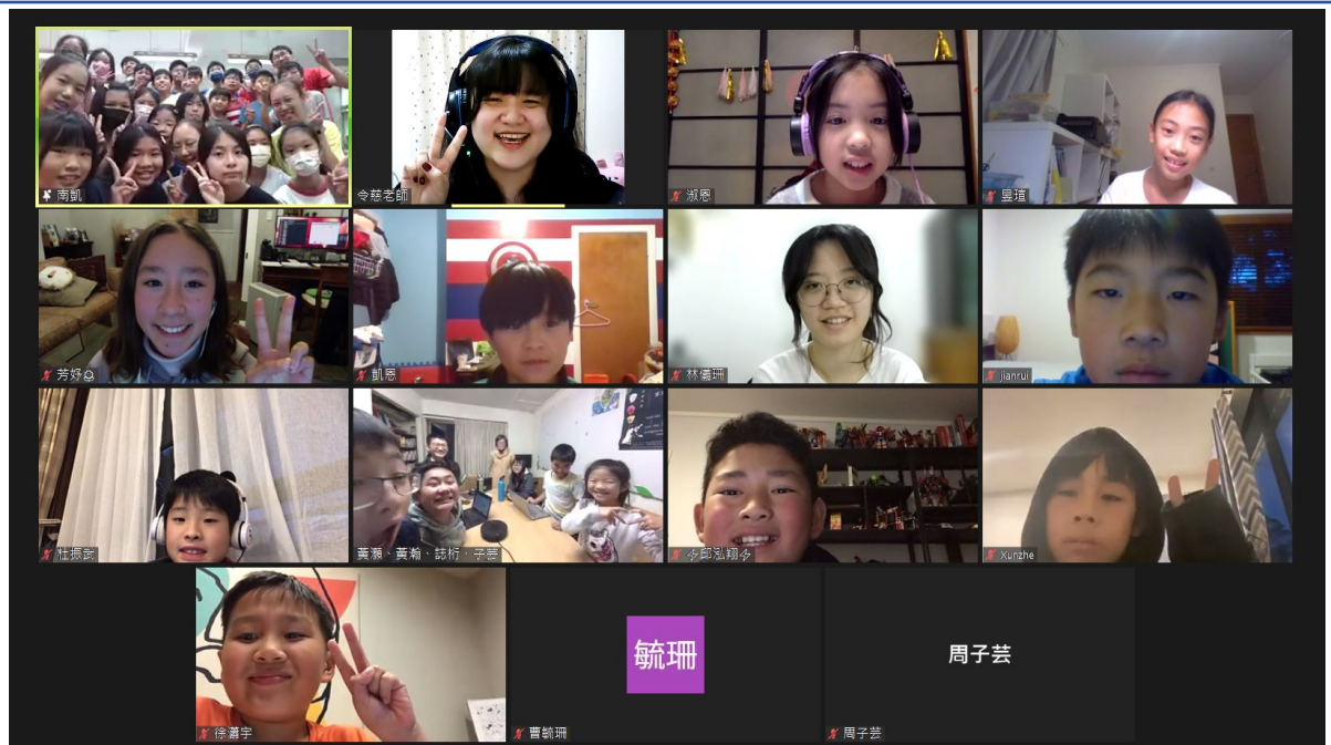
鳳興書院與雲林縣安慶國小畢業班線上交流合影