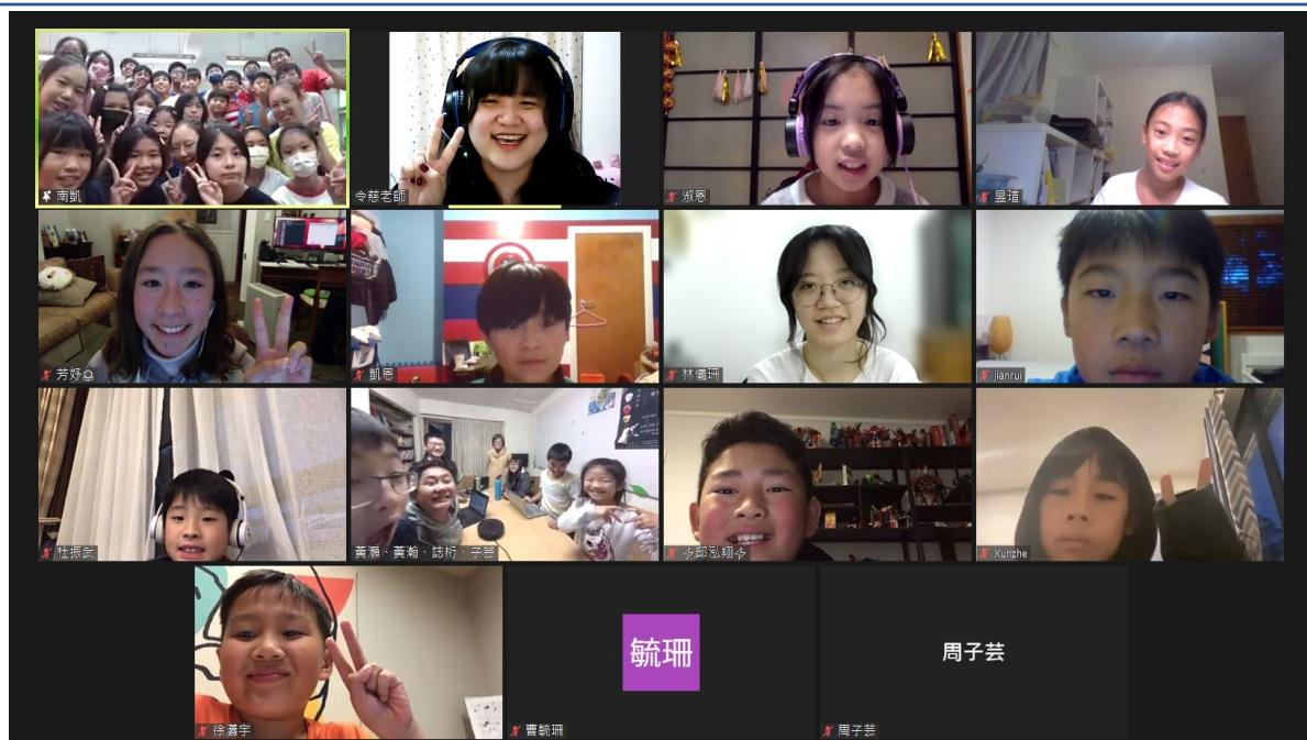
鳳興書院與雲林縣安慶國小畢業班線上交流合影