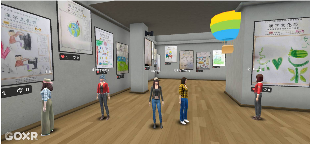
漢字文化節-元宇宙展場, 作品展覽