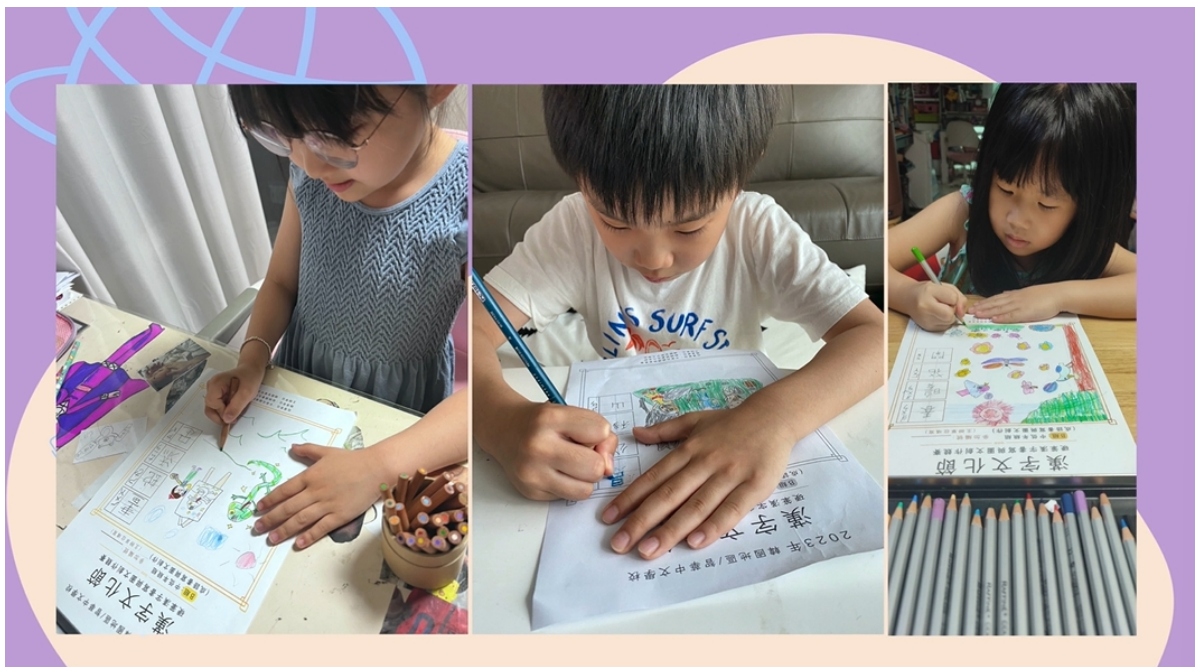
漢字書寫活動-圖文創作