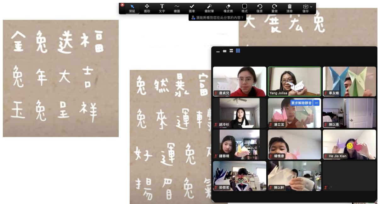
福兔迎春 - 手工摺紙和玉兔吉祥話。

兩校攜手合作，不僅促進了華語教學的發展，還讓學生們在這一年中取得了豐收的成果，給學生們帶來一個豐富而有意義的學習經歷。兩校皆表示這兩年的合作非常愉快，也期待未來這樣的合作能繼續延續。除了提供臺灣華語老師更多的機會與經驗，更為美國的學生提供了優質的華語學習機會。