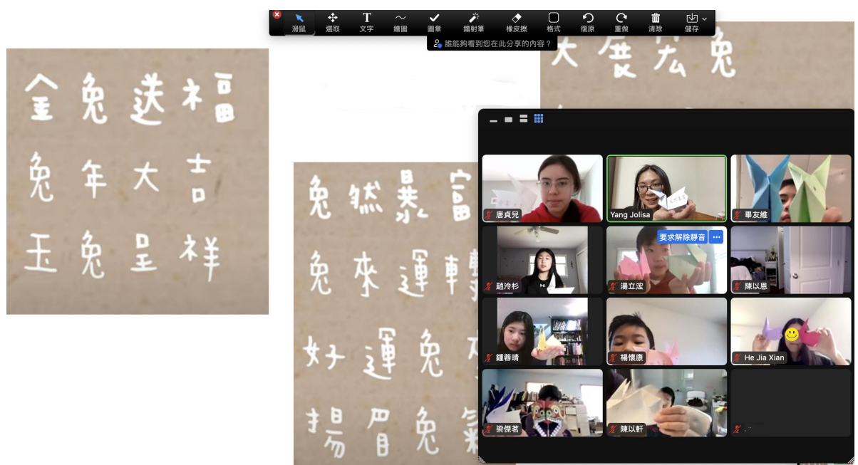
福兔迎春 - 手工摺紙和玉兔吉祥話。

兩校攜手合作，不僅促進了華語教學的發展，還讓學生們在這一年中取得了豐收的成果，給學生們帶來一個豐富而有意義的學習經歷。兩校皆表示這兩年的合作非常愉快，也期待未來這樣的合作能繼續延續。除了提供臺灣華語老師更多的機會與經驗，更為美國的學生提供了優質的華語學習機會。