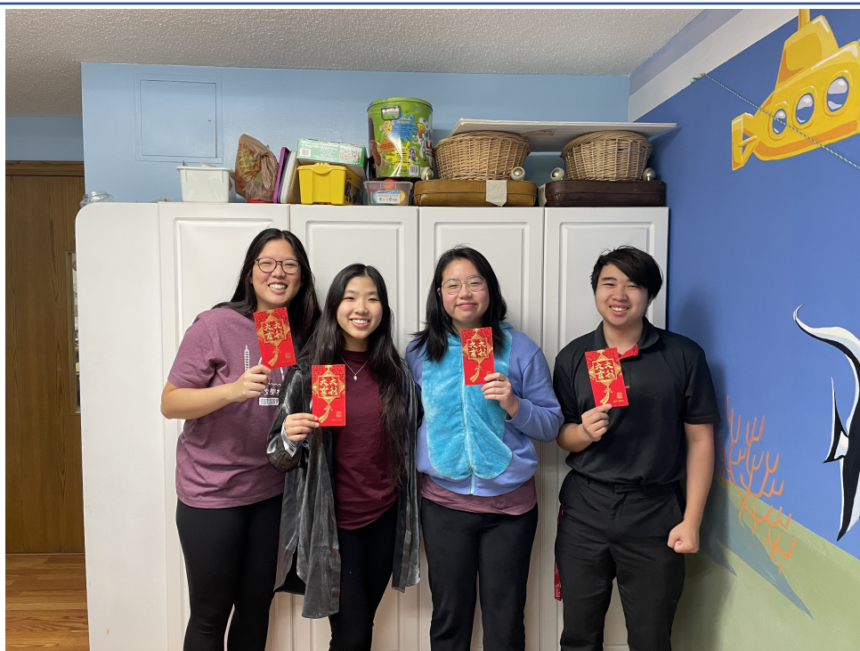
2023第一季正體漢字識讀競賽1