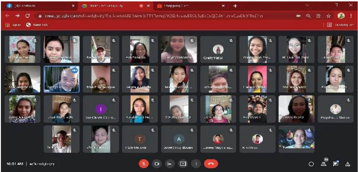
圖3:學生在線上注意聽老師講臺語課