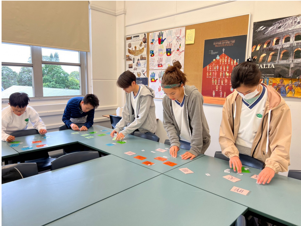
高年級學生漢字辨識