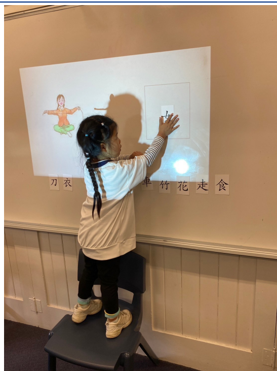
低年級學生進行漢字配對