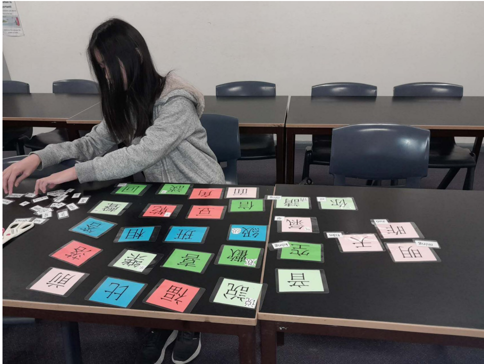
學生進行漢字辨識配對