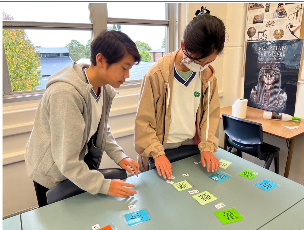
高年級學生漢字辨識