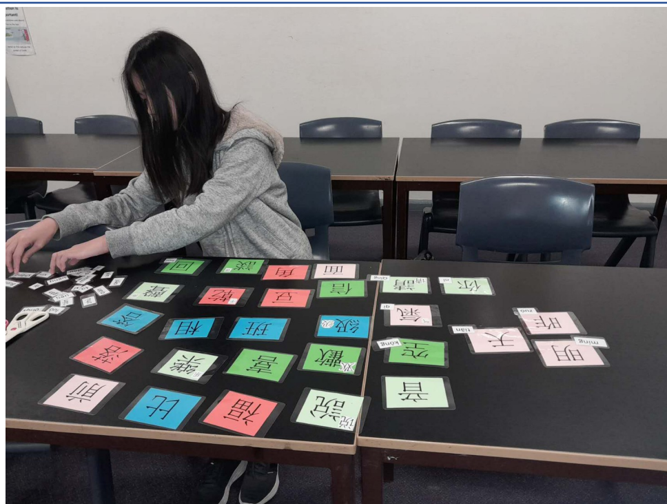
學生進行漢字辨識配對