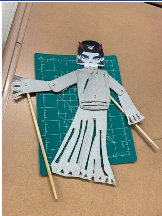
已完成的劇中人物之一「白骨精」。