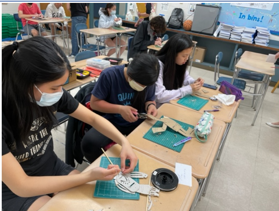
同學們聚精會神的製作皮影戲偶