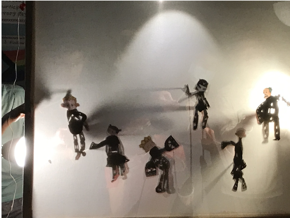
男生組同學們所製作的皮影戲偶合照