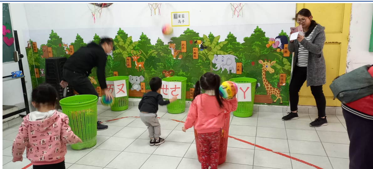
2023漢字文化節 親子注音闖關語文活動2