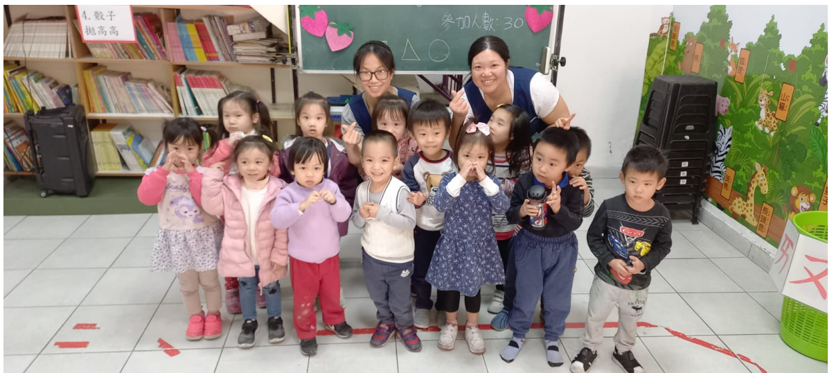
2023漢字文化節 親子注音闖關語文活動1

希望藉由遊戲中學習，讓孩子感受學中文的樂趣，感謝老師們用心良苦、竭盡心力的設計策劃，讓孩子學中文的路上留下多采多姿多元的美好回憶！