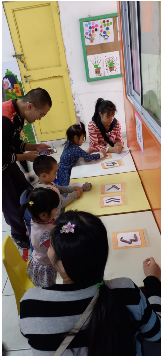
2023漢字文化節 親子注音闖關語文活動6