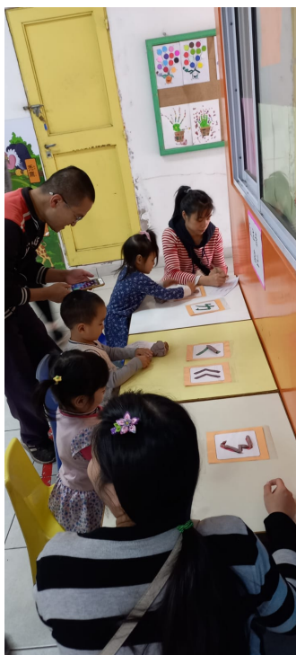
2023漢字文化節 親子注音闖關語文活動6