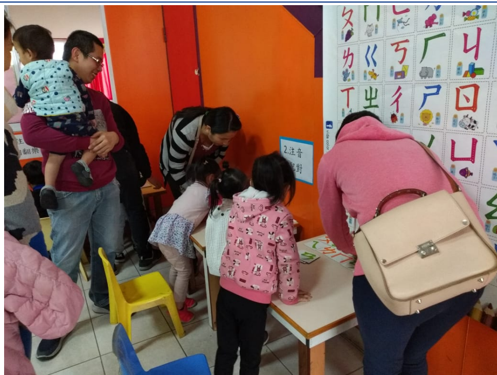
2023漢字文化節 親子注音闖關語文活動4