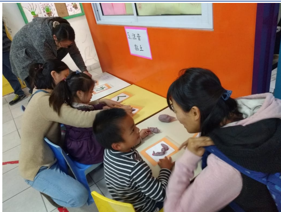
2023漢字文化節 親子注音闖關語文活動3