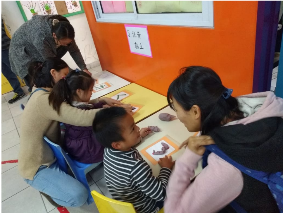
2023漢字文化節 親子注音闖關語文活動3