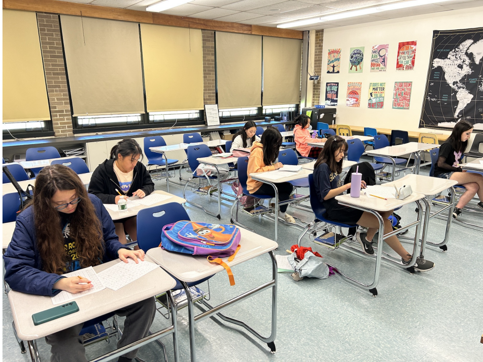
拼音班學生參加認字比賽