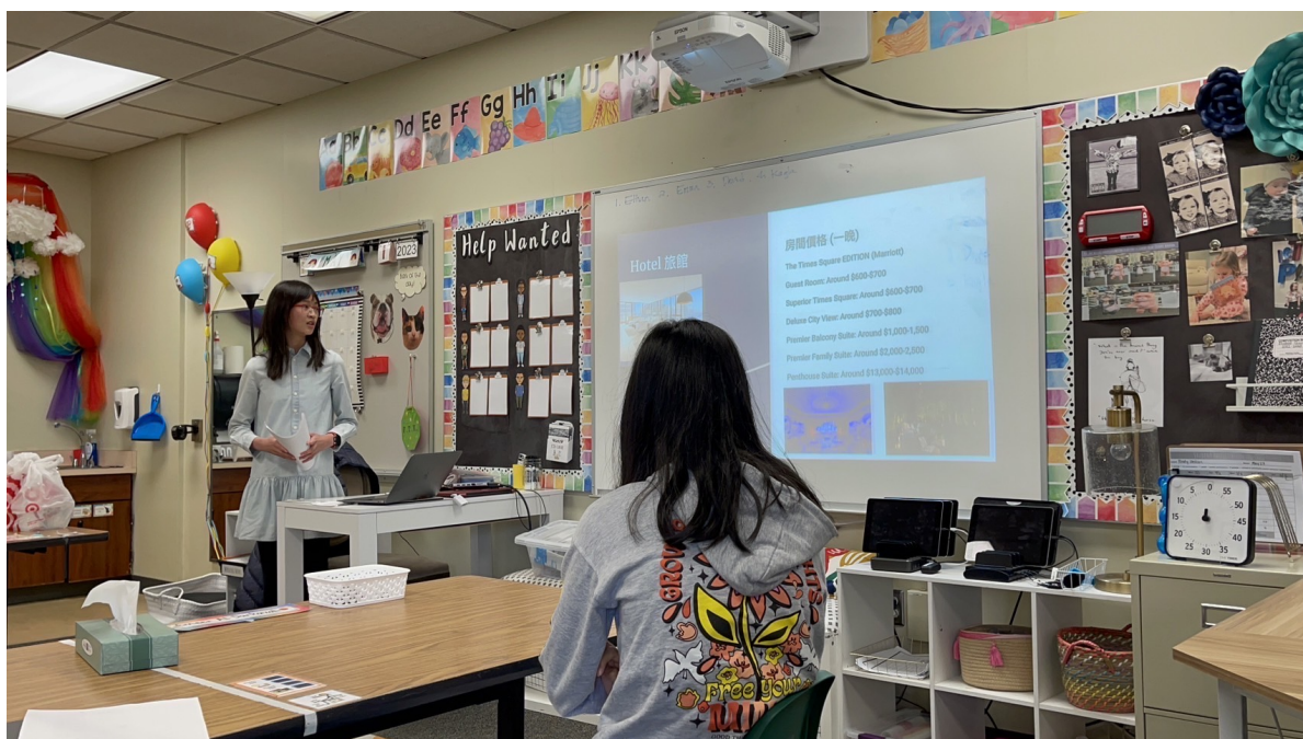
8年級 我的夢幻之旅：一個兩天一夜旅遊的提案