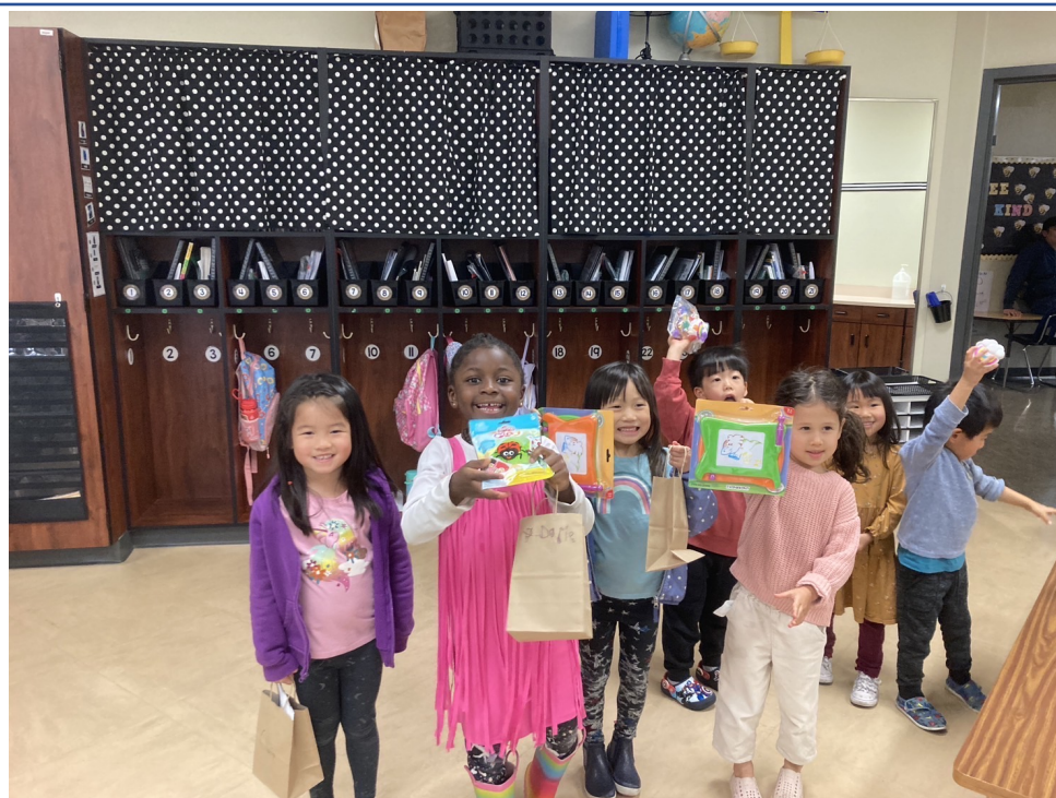
K班 看字卡讀出注音、上課學過的字、或回答簡單的問題