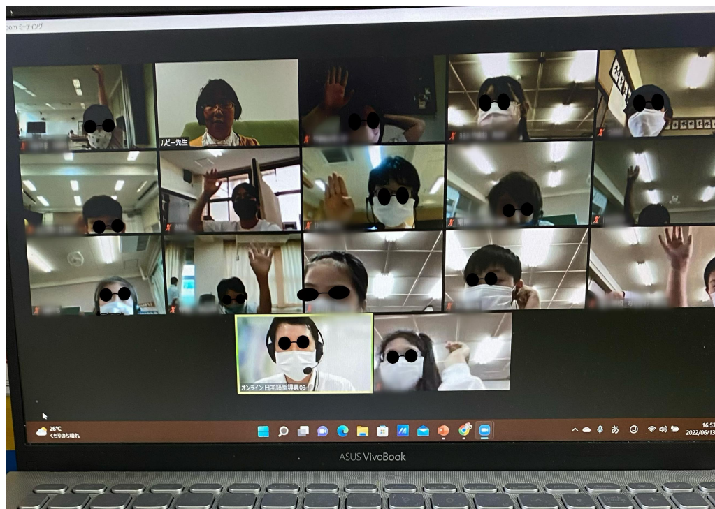
大阪線上国際倶楽部～台湾文化線上課程