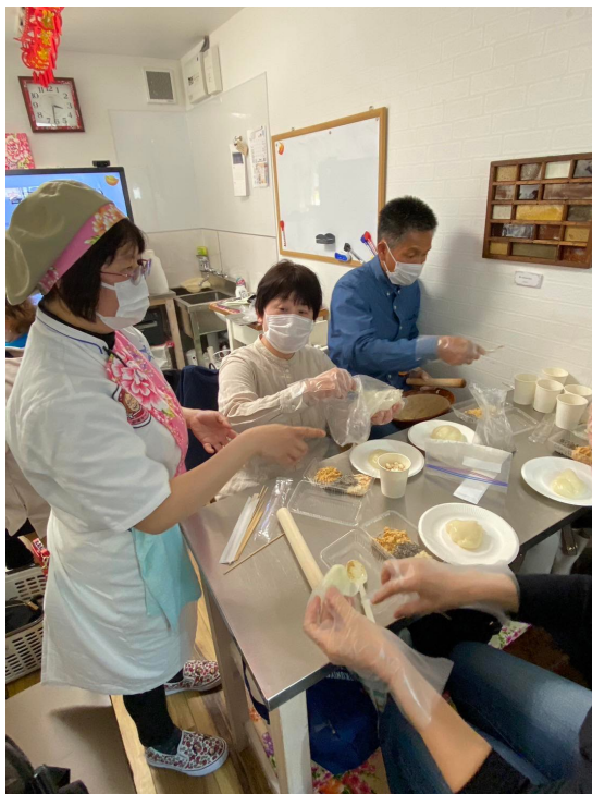
客家麻糬的製作體驗

臺灣是多元文化社會，對於族群文化的延續並不是一件容易的事，尤其在海外傳承更是不易。駐大阪辦事處結合僑校首次舉辦客家文化研習活動，讓參加者從吃(客家麻糬)、喝(客家擂茶)、玩(客家花布竹蟬)，由指尖到舌尖親身體驗，期望達到寓教於樂，讓客家文化可以在海外持續傳揚。