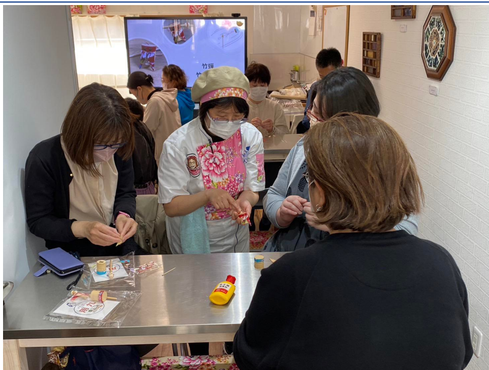
教授大家製作客家花布的台灣童玩-竹蟬