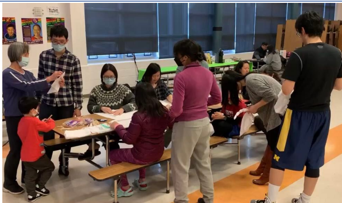
華府臺灣學校舉辦2023臺灣傳統客家藍染與現代植物染布文化教學3