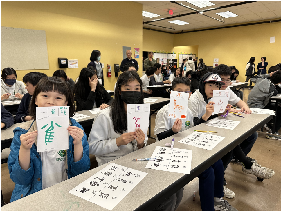
中高年級漢字演變體驗活動書寫