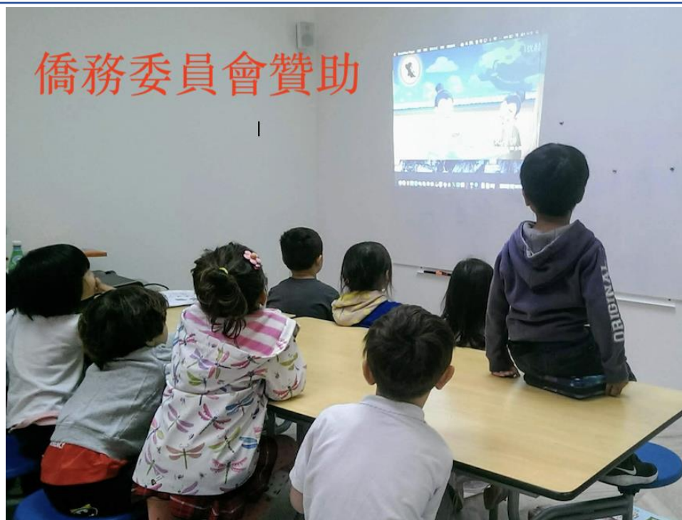
TCC期末學藝競賽-漢字聽說讀寫挑戰賽