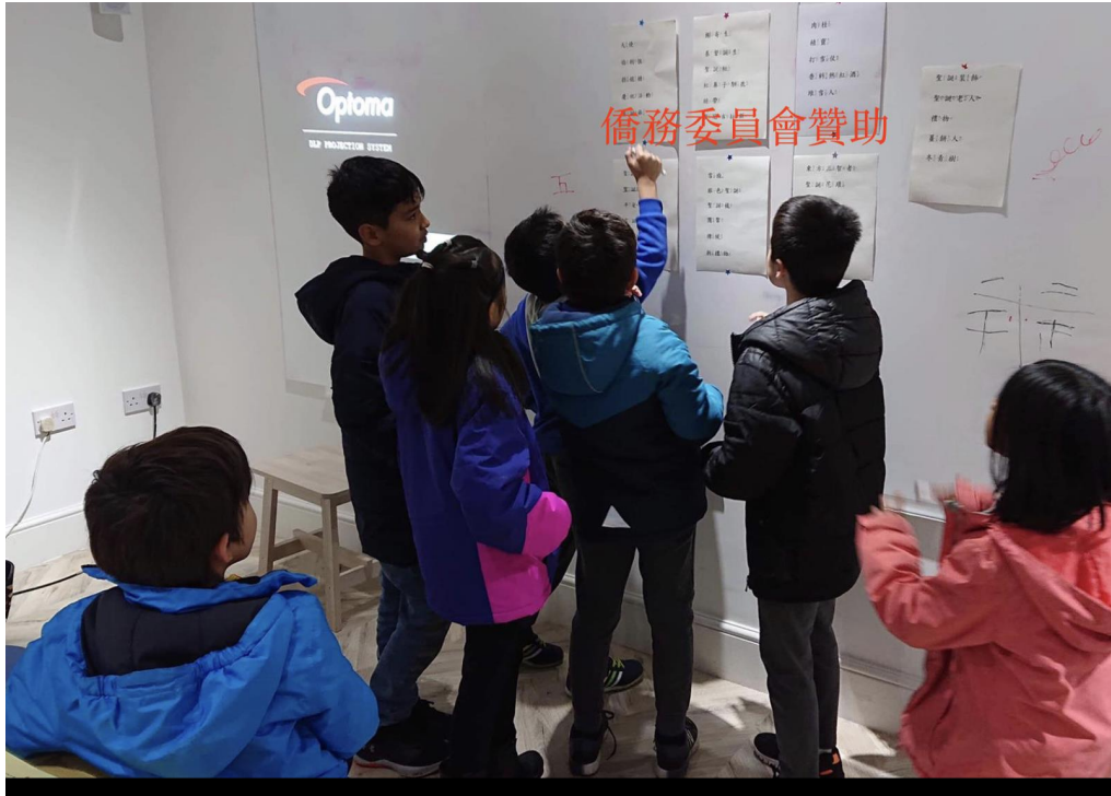
TCC期末學藝競賽-漢字聽說讀寫挑戰賽