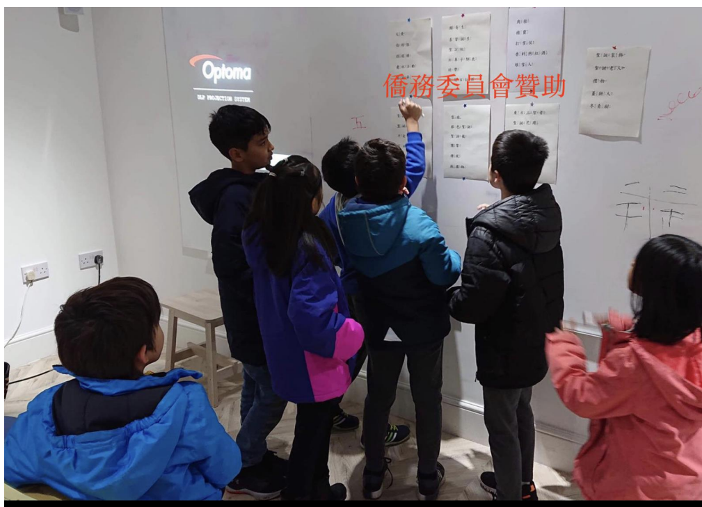
TCC期末學藝競賽-漢字聽說讀寫挑戰賽