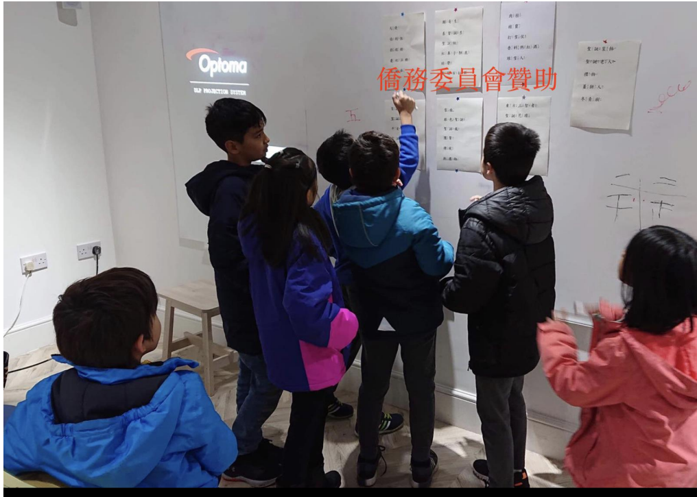
TCC期末學藝競賽-漢字聽說讀寫挑戰賽