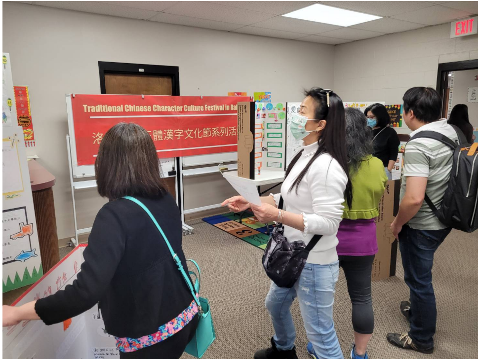
洛麗中文學校幹部仔細進行評分工作