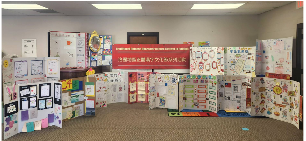
參加 2023 正體漢字文化節海報競賽的班級海報