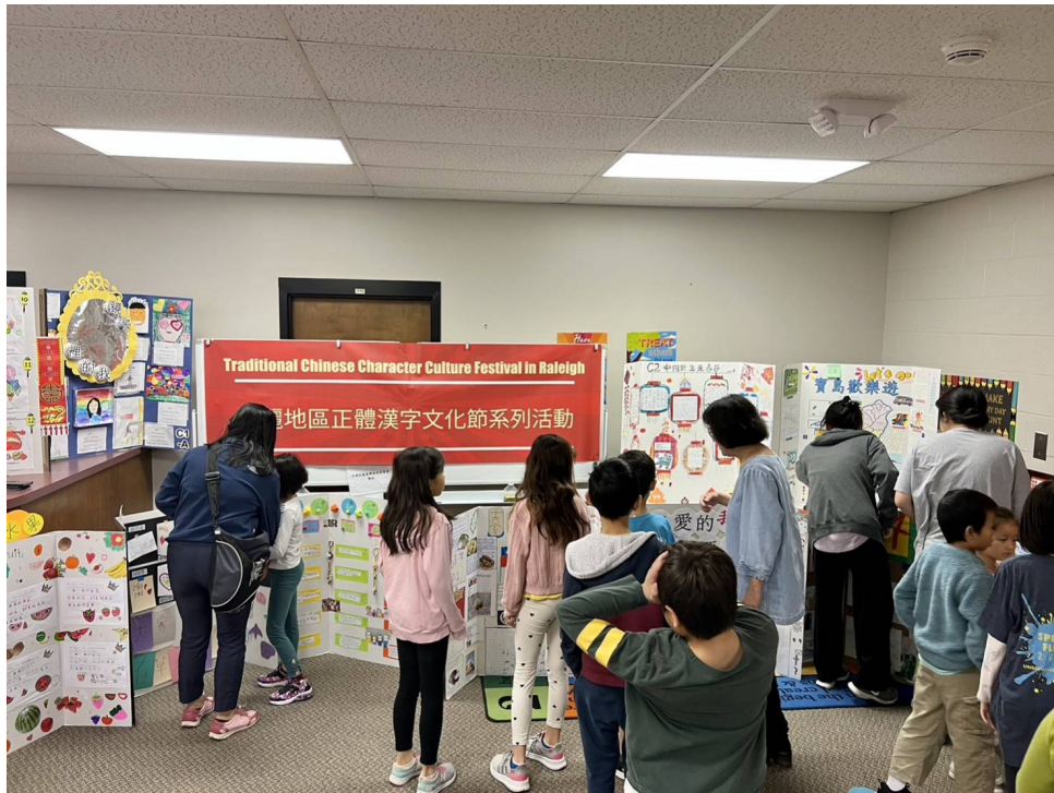
老師帶領學生參觀各班海報