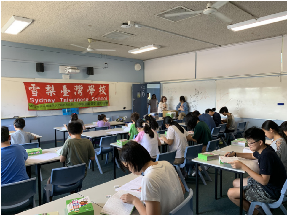
西北校區學生專注查字典