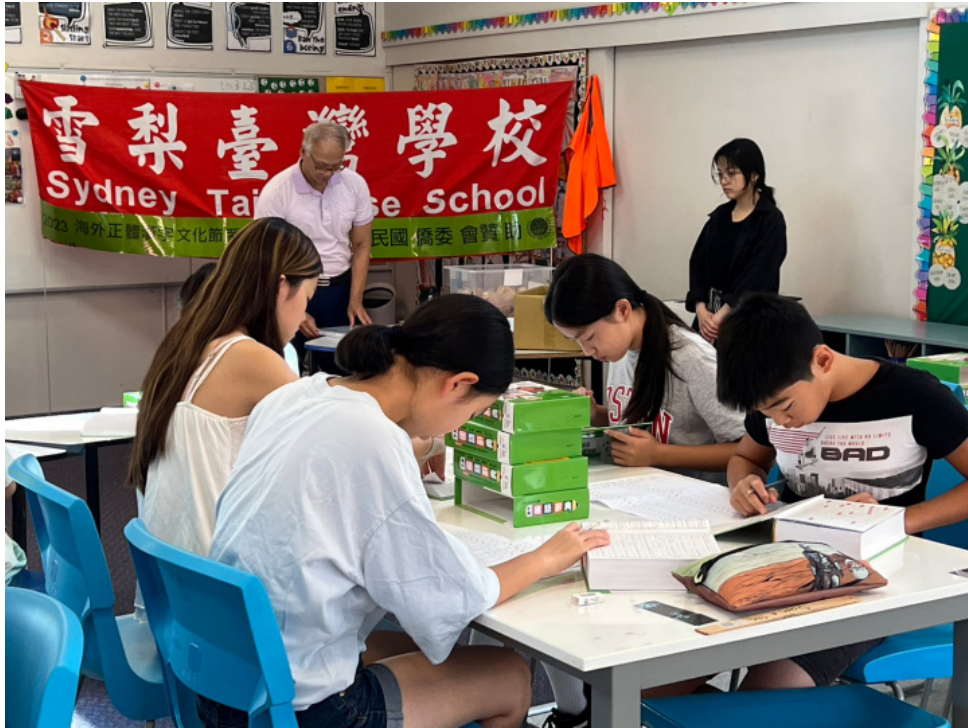
北岸高年級學生聚精會神查字典