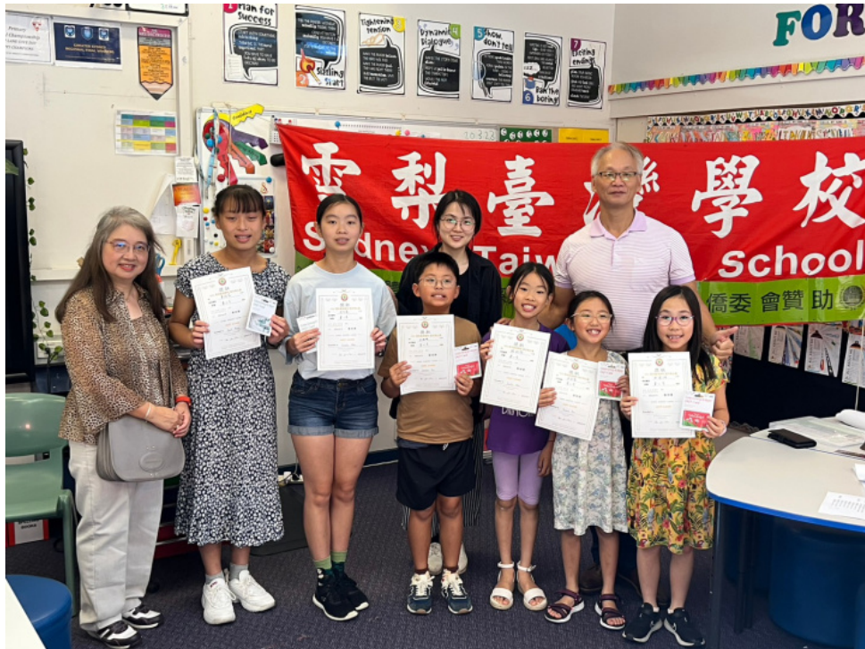
得獎學生與校長老師合影