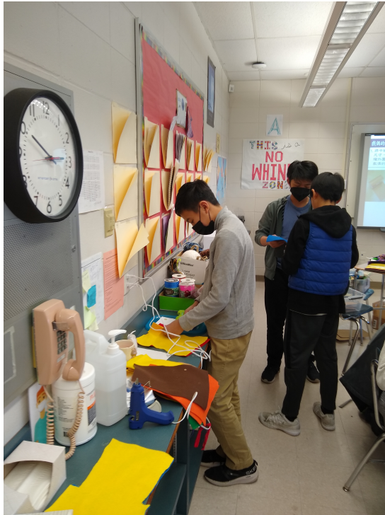
布偶的衣服設計小站：小絨球、毛線、中國結線、金蔥鐵線和熱膠槍