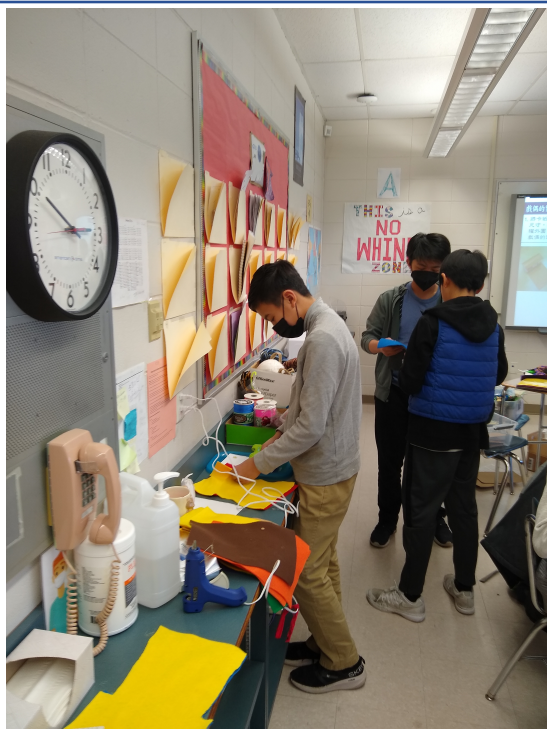
布偶的衣服設計小站：小絨球、毛線、中國結線、金蔥鐵線和熱膠槍