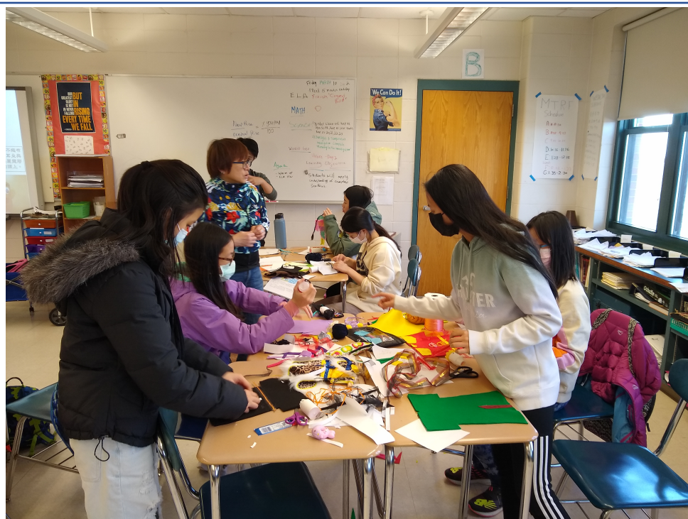
學生開始動手作出心目中的布偶人物