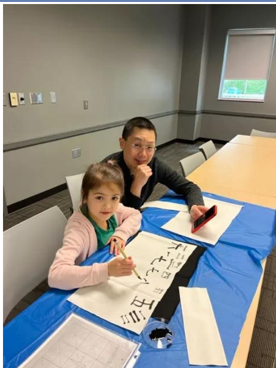
家長陪同學生一起學習書法