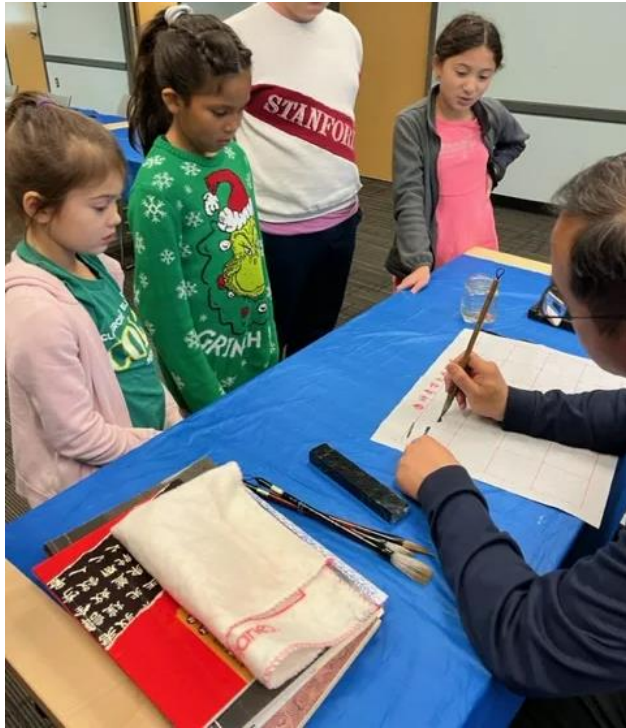
老師師範書寫方式給學生看