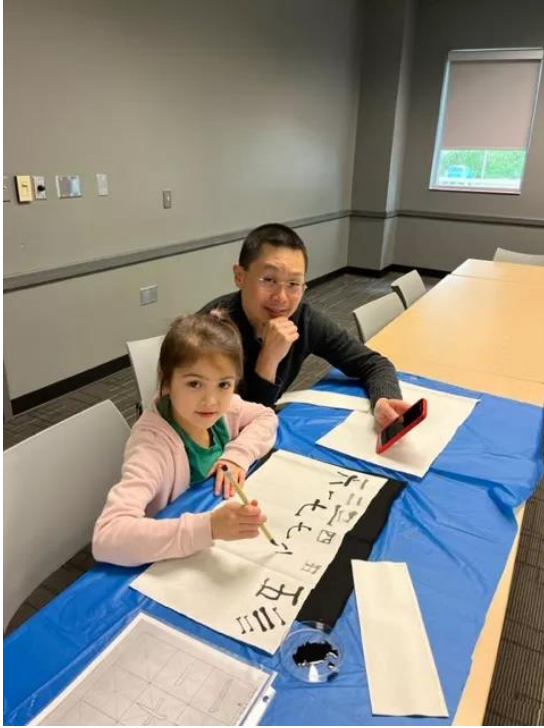
家長陪同學生一起學習書法