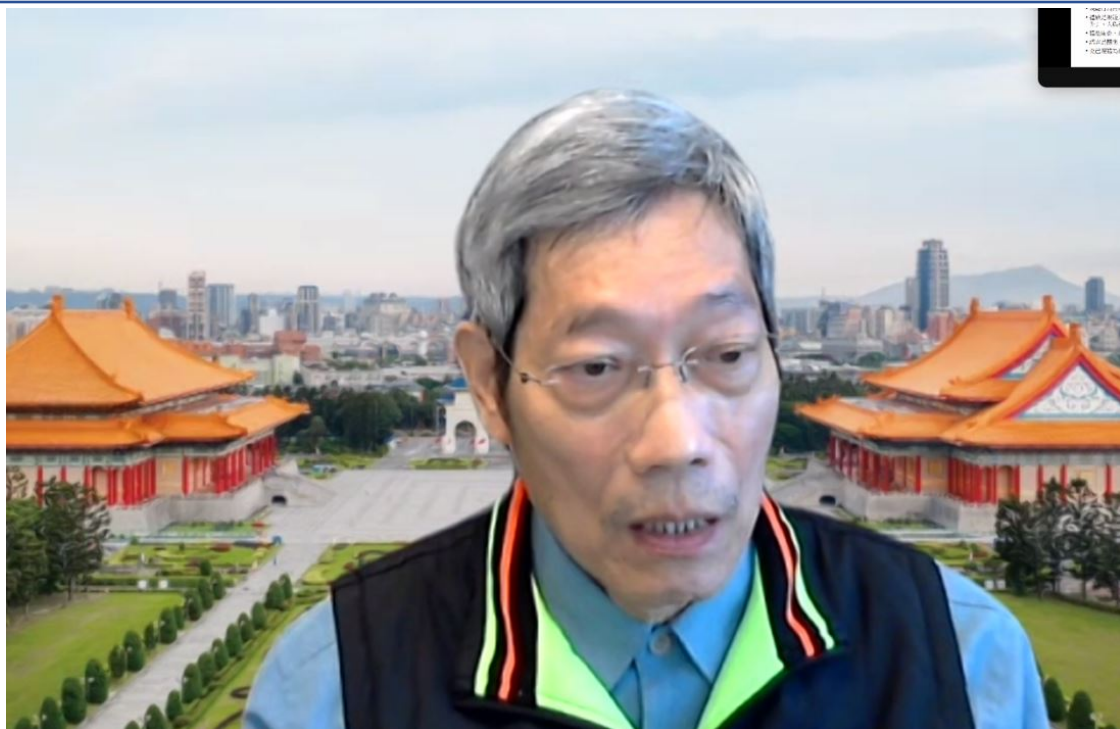
主講嘉賓國立臺灣師範大學華語文教學系陳振宇教授