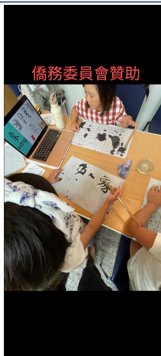
2022正體漢字文化節「唐詩唱遊比賽」1