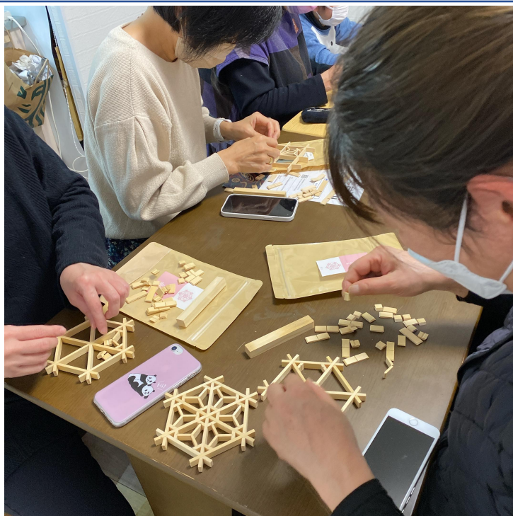
參加者們體驗組合木花窗的杯墊