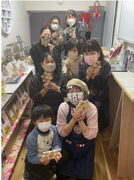
大家完成自己的杯墊作品