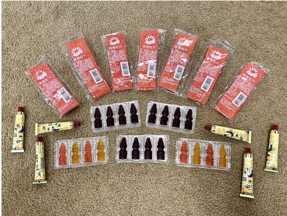
克里夫蘭中文書院2022學年度國際數位學伴計畫3