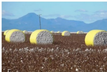
收割後打包的棉花