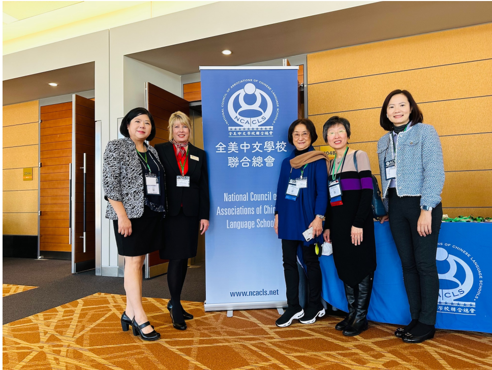
全美中文學校聯合總會ACTFL午宴講座