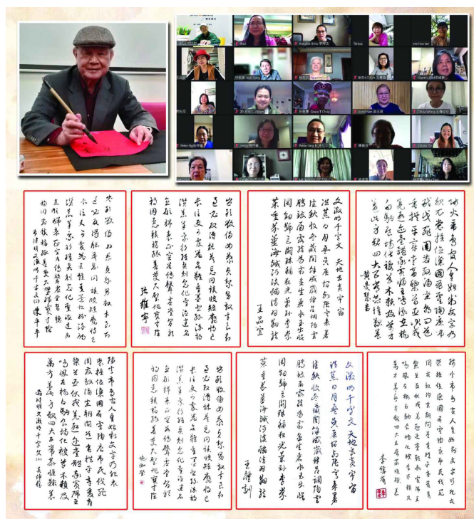
中華文化復興運動總會主辦文經總會文教服務中心協辦2022「菲華暑期文教研習會」線上舉行始業式2