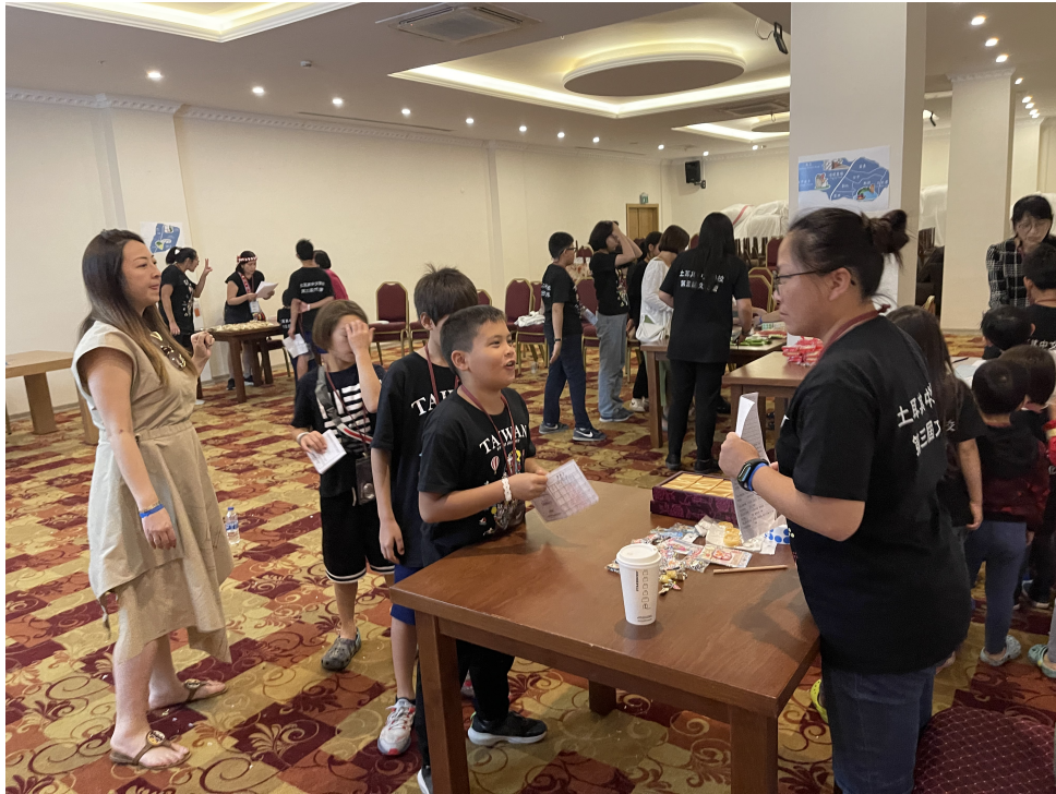
環島遊臺灣闖關換大獎