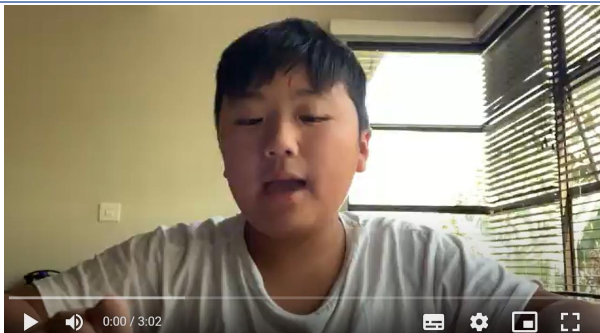
小學部說故事比賽-馬頭琴的故事