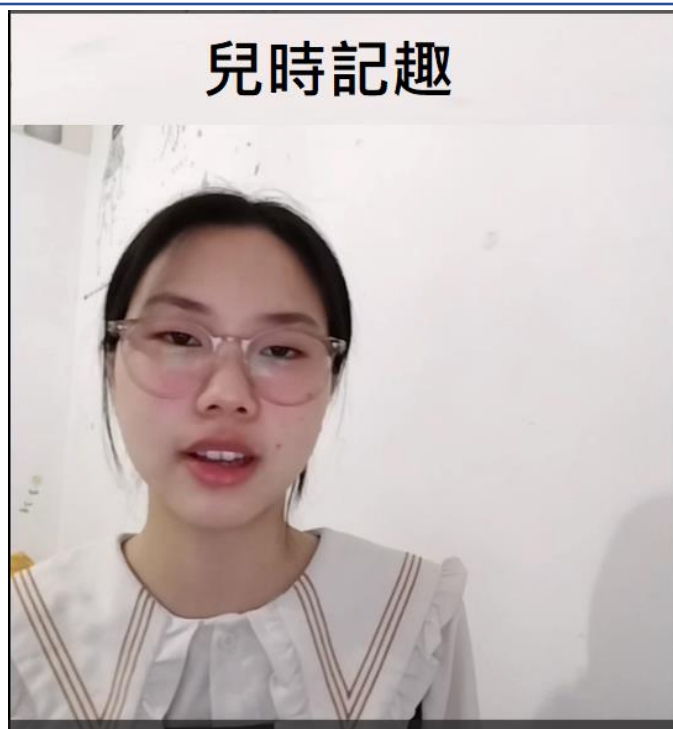
中學部說故事比賽-兒時記趣