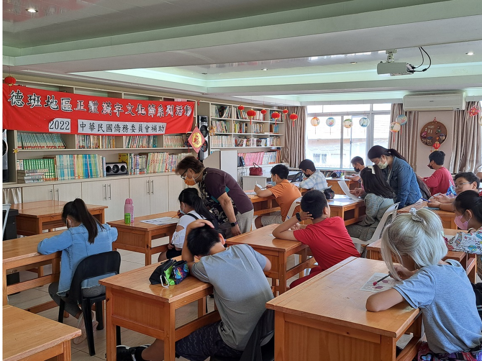
國慶閱讀測驗考場