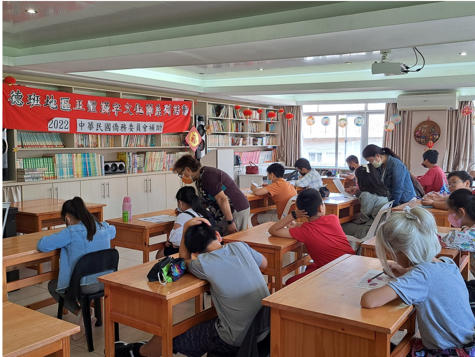
國慶閱讀測驗考場