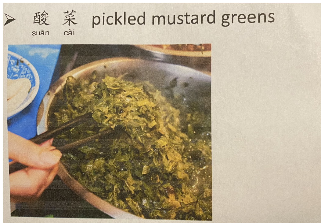
中佛州中華學校2022臺灣華語文文化課1

吃！是每個人都想的，人以食為天，因學生的要求我們就辦一場大家都熟悉的漢堡也就是「刈包」！刈包是以麵皮包覆著，裡頭夾入餡料，這個對我們學生來說接受率挺高的，這很像英國三明治，意大利panino，猶太人的貝果，西安的肉夾饅。臺灣刈包可真特別，根據調查在2006年美籍韓裔在曼哈頓開了刈包跟拉麵打出了名號，在歐陸也陸續開了，其中在倫敦SOHO區開業，招牌就是"BAO"，刈包也成為年輕人喜愛的新潮食物。