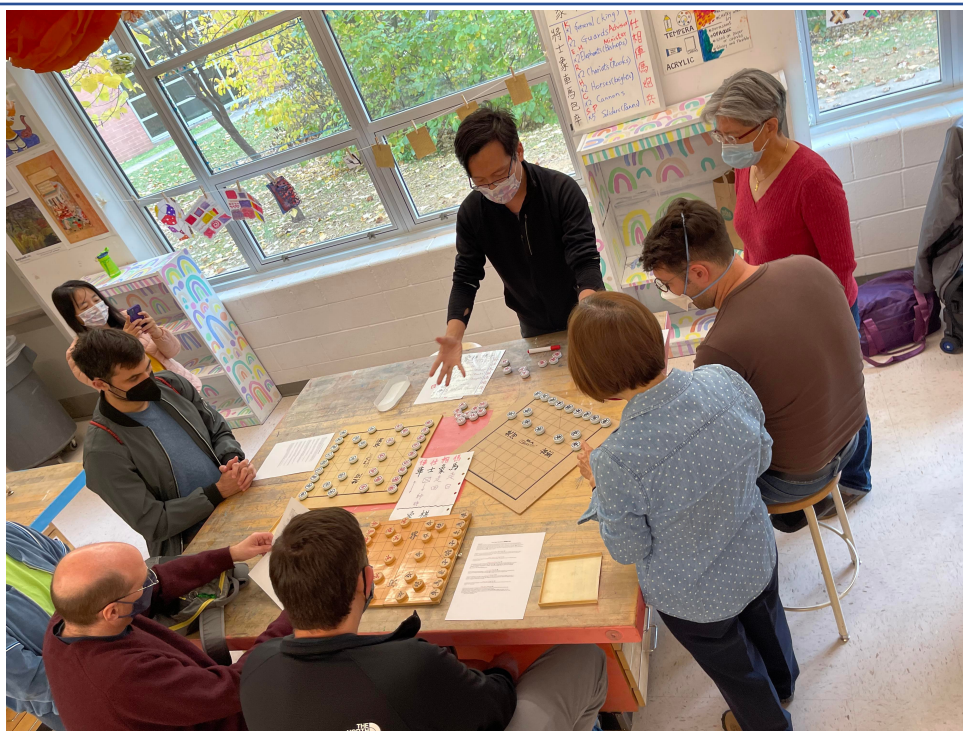
2022年臺灣學校華語文中心舉辦象棋研習並品嚐臺中名產太陽餅5