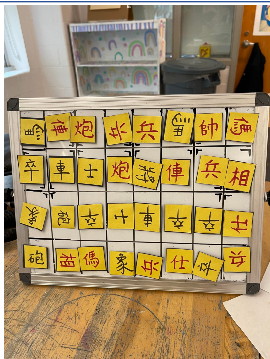
2022年臺灣學校華語文中心舉辦象棋研習並品嚐臺中名產太陽餅3