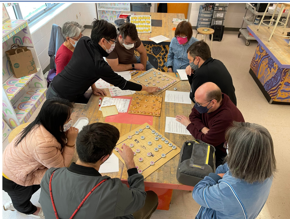
2022年臺灣學校華語文中心舉辦象棋研習並品嚐臺中名產太陽餅2