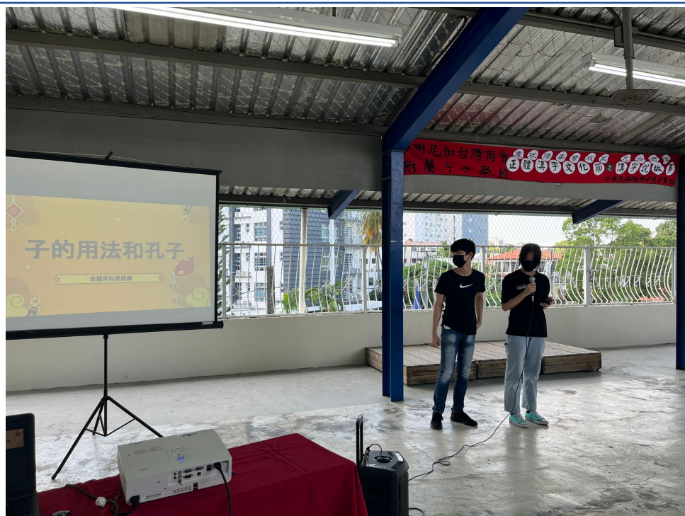
多明尼加臺灣商會附屬中文學校2022年海外漢字文化節之漢字說故事4