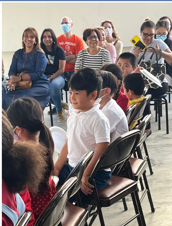
多明尼加臺灣商會附屬中文學校2022年海外漢字文化節之漢字說故事2