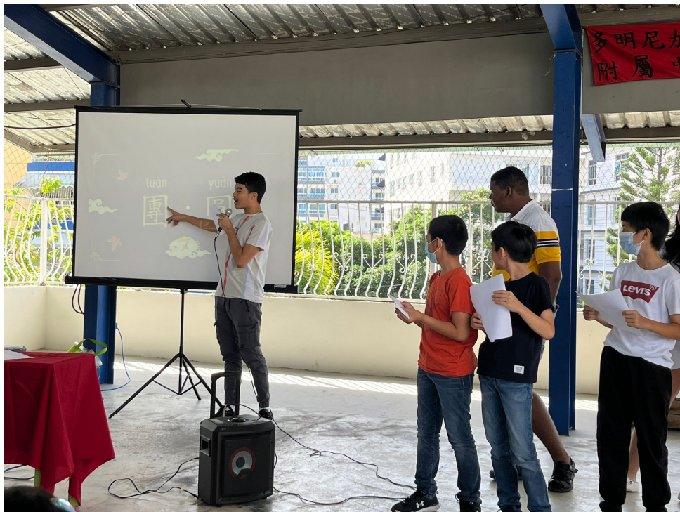
多明尼加臺灣商會附屬中文學校2022年海外漢字文化節之漢字說故事1

活動內容為「家人」、「感謝」、「節日」、「茶和月」、「團圓」、「嫦娥奔月」及「孔子」。分別以歌唱、朗誦、說故事及演講的方式進行。活動最後，與會來賓都給予學生最大的鼓勵和肯定。