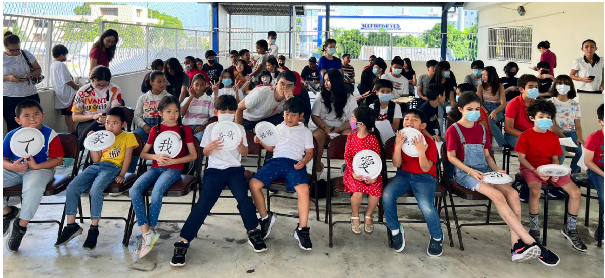
多明尼加臺灣商會附屬中文學校2022年海外漢字文化節之漢字說故事5