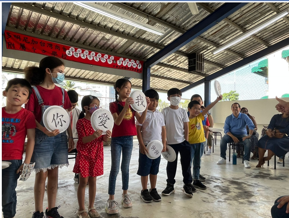
多明尼加臺灣商會附屬中文學校2022年海外漢字文化節之漢字說故事3