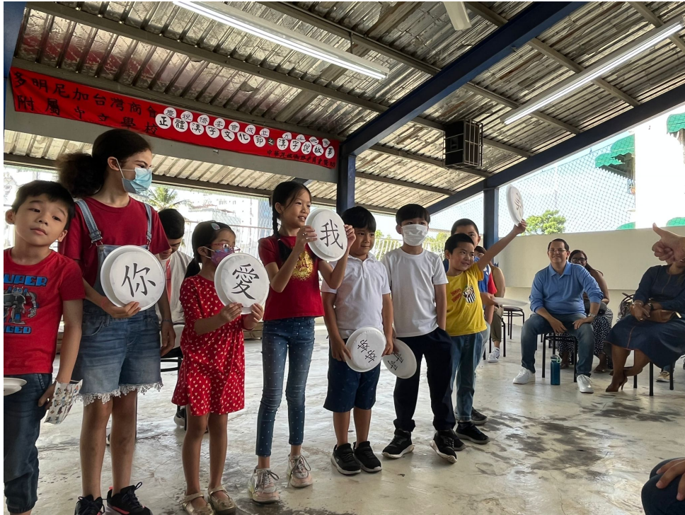
多明尼加臺灣商會附屬中文學校2022年海外漢字文化節之漢字說故事3