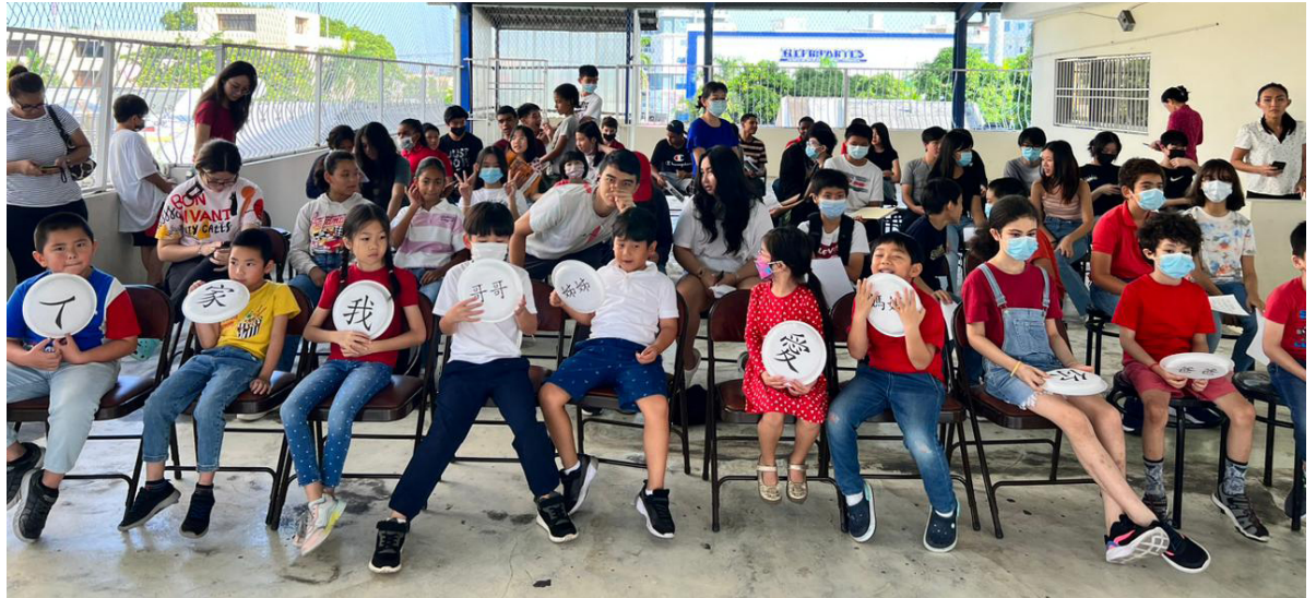
多明尼加臺灣商會附屬中文學校2022年海外漢字文化節之漢字說故事5