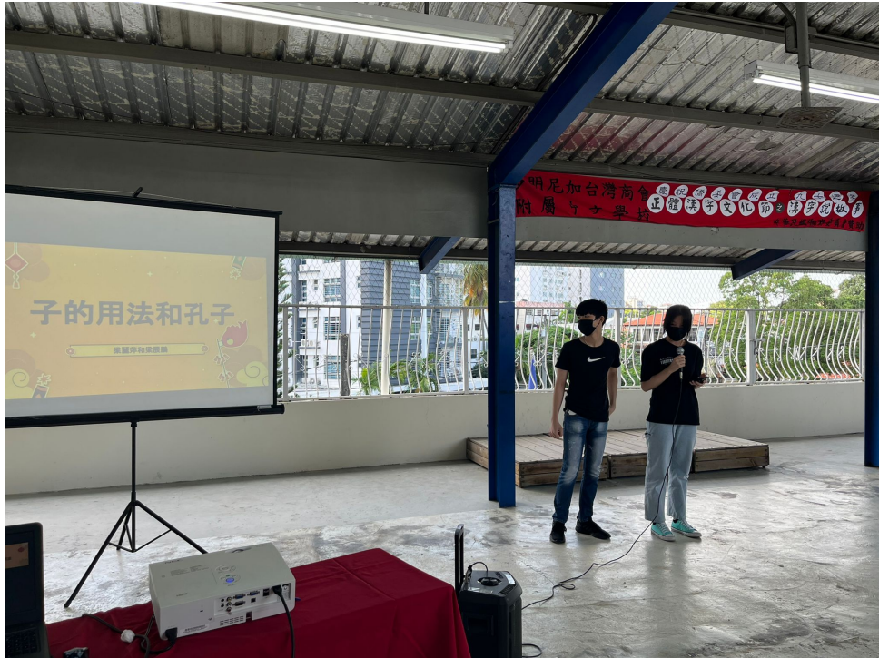
多明尼加臺灣商會附屬中文學校2022年海外漢字文化節之漢字說故事4