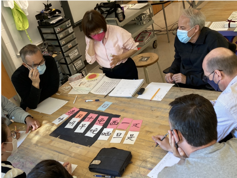
臺灣學校華語文中心舉辦2022年漢字文化節拼字遊戲競賽6