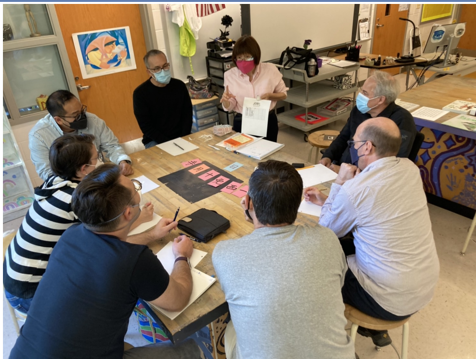
臺灣學校華語文中心舉辦2022年漢字文化節拼字遊戲競賽2