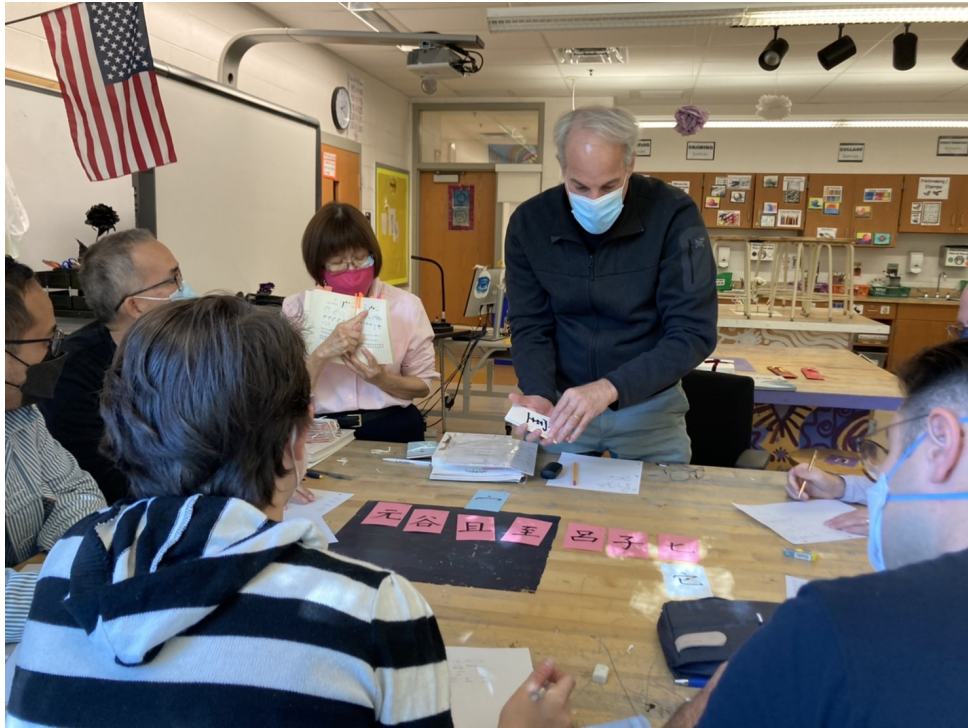
臺灣學校華語文中心舉辦2022年漢字文化節拼字遊戲競賽5