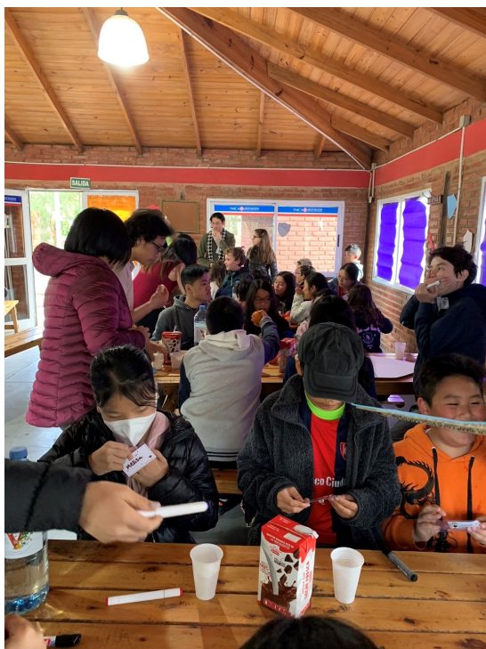
新興中文學校與國際部2022年校外聯合活動2