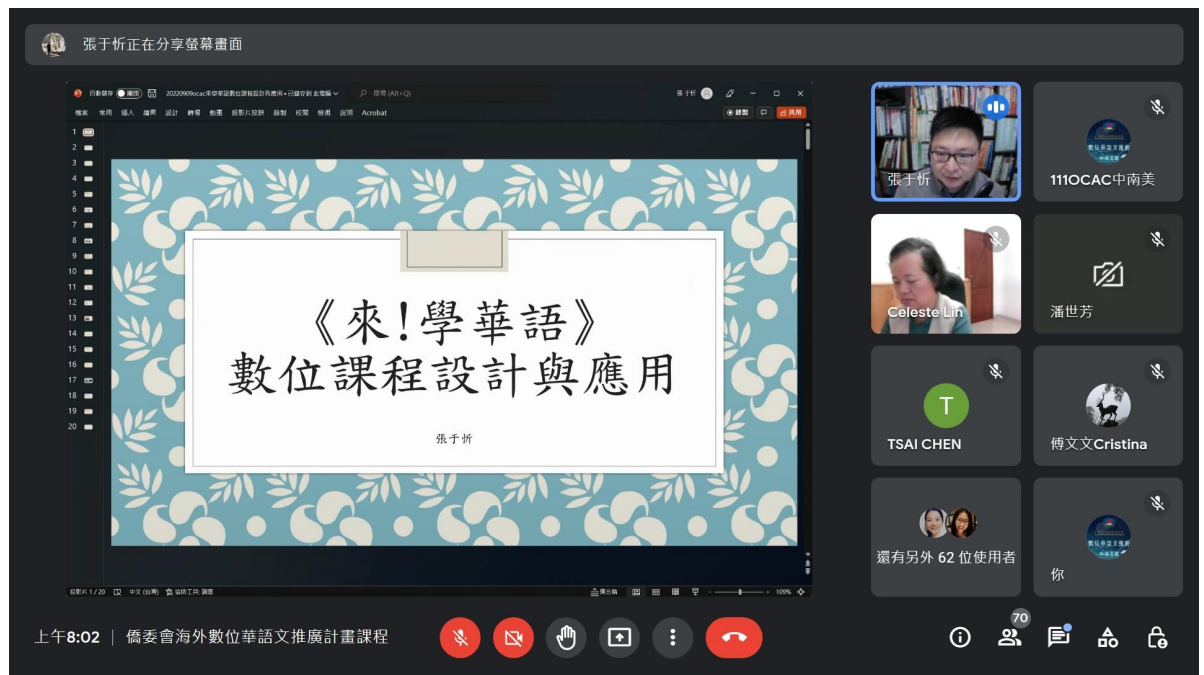
《來！學華語》數位課程設計與運用上課情形

承辦單位本次規劃了「MyCT」《來！學華語》口說練習課程教學運用、《學華語向前走》入門基礎正音教學課程設計、「全球華文網」幼兒趣味教學活動、《來！學華語》數位課程設計與運用等課程，從各個不同的面向提升中南美洲華語教師的數位教學能力。各門課程除運用《學華語向前走》、《來！學華語》教材、全球華文網與政府資源外，同時提供學員在實際的華語遠距課堂中能夠簡易上手、提升效率的教學工具，以滿足全球疫情及數位化的時代趨勢。