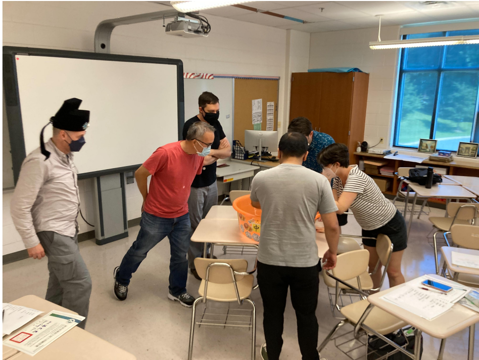
臺灣學校華語文中心土地公戳戳樂和狀元搏餅2022熱鬧登場1