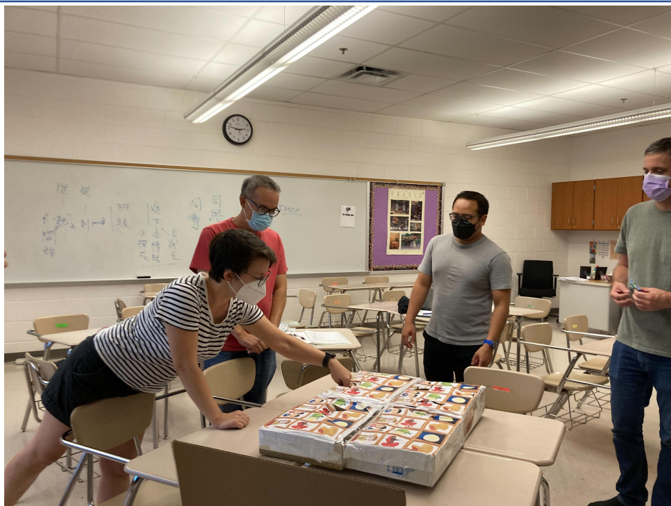
臺灣學校華語文中心土地公戳戳樂和狀元搏餅2022熱鬧登場2