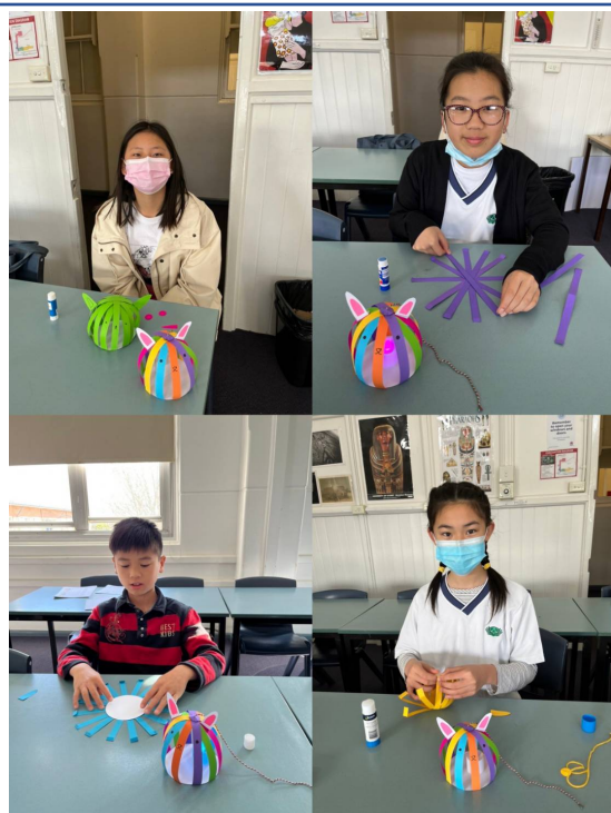
學生手作中秋燈籠