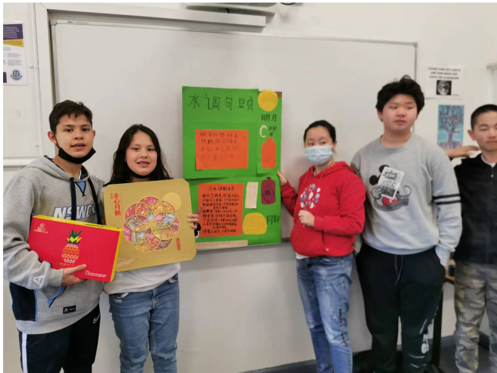
製作傳統詩詞水調歌頭介紹

澳洲慈濟人文學校於9月11日舉辦中秋節慶祝活動，透過中秋節教學，介紹與月亮相關的節慶故事、傳統的習俗及應景的食物，教導學生親手製作燈籠、發揮創意製作「水調歌頭」介紹及品嚐月餅等，讓海外華人子弟有機會瞭解中秋節由來、傳說、習俗及節慶食品，感受中秋節團圓的內涵，和華人借賞月思親的情感表達方式，也認識月圓代表圓滿和幸福意涵，培養孩子熱愛傳統文化的情感。並透過結合華語文學習，學生無不聚精會神專心聆聽教師講解介紹，了解古典詩詞的情感抒發，製作中秋節燈籠，手把手的傳承，發揮創意呈現極具特色作品，讓學生了解博大精深的中華文化，能持續在海外傳承。