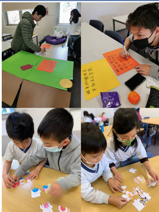
中秋節主題拼圖與傳統詩詞製作