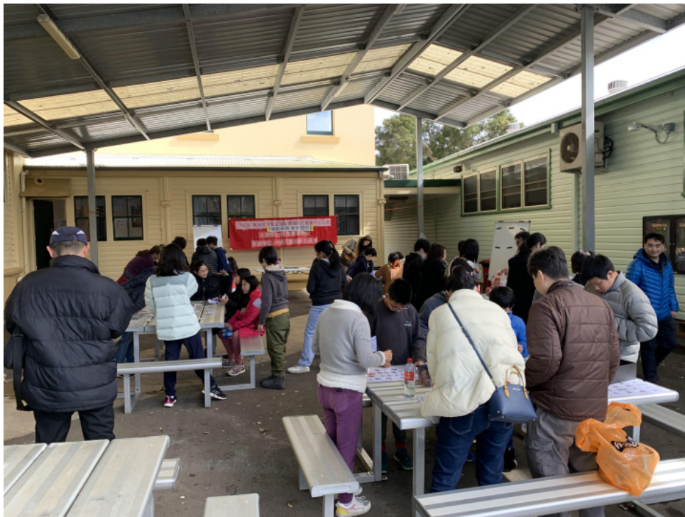
漢字闖關活動場景

正體漢字有豐富的文化根基，字型字義相容匹配有故事淵源、有如詩如畫的意境背景，更是歷史傳承的重要載體。雪梨臺灣學校30多年來堅持正體漢字教學就是堅持這樣的歷史文化價值，期許正體漢字的美、價值與文化意涵能在海外僑界持續發展下去、永生不息。