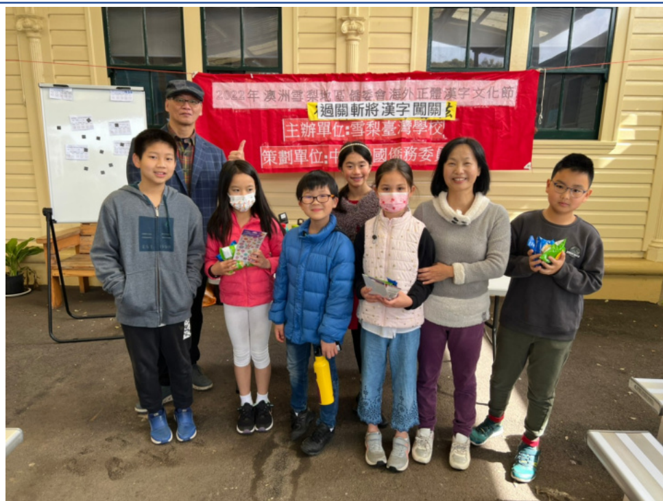
獲獎學生與校長合影