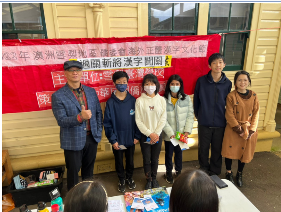
獲獎學生與校長合影