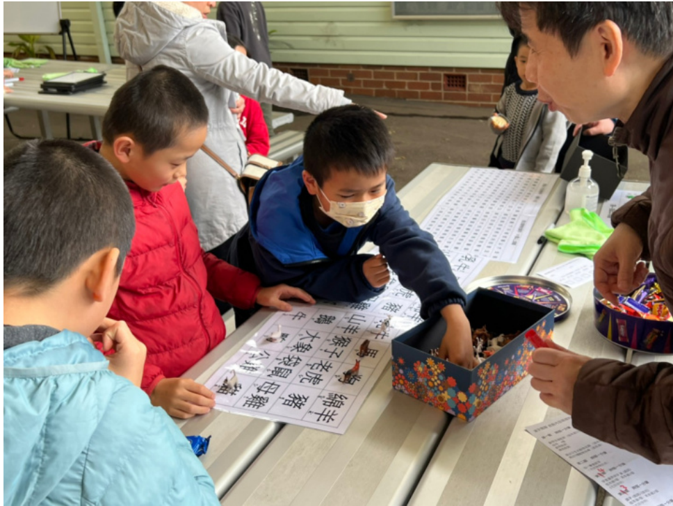
動物與漢字配對遊戲