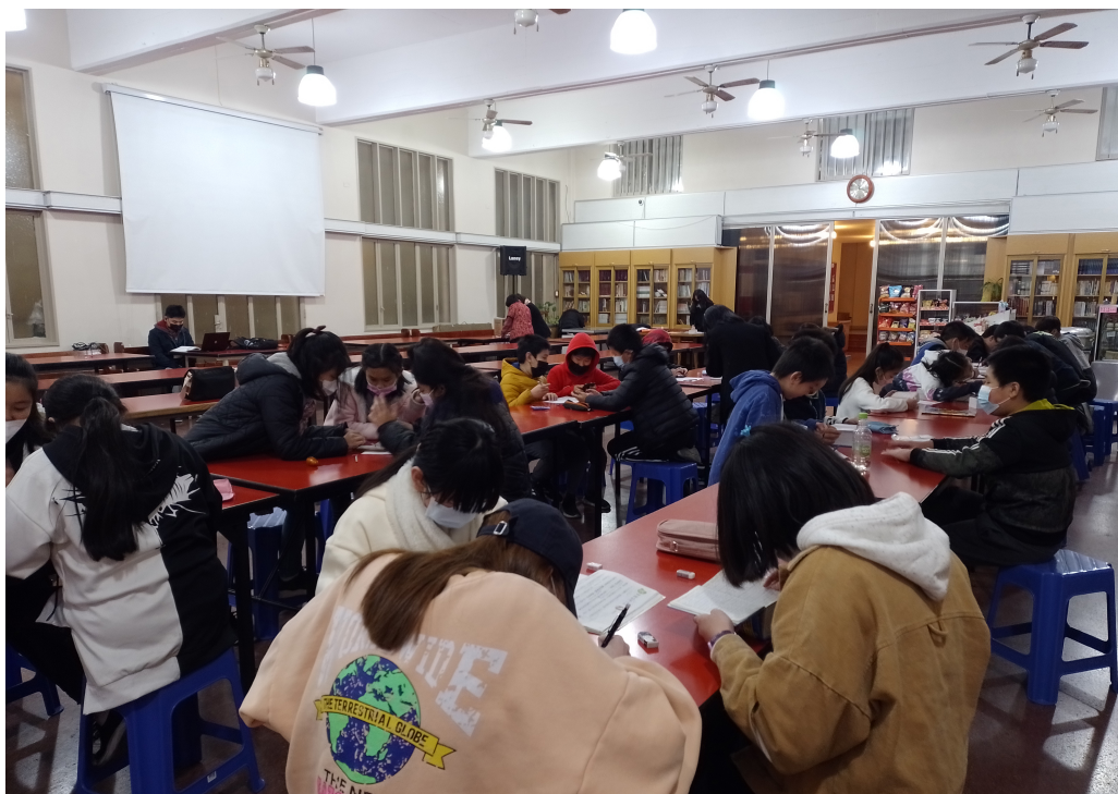
2022學年度愛育學校「正體漢字文化節國語文國小中低年級組造詞比賽及 高年級組語詞接龍比賽」6