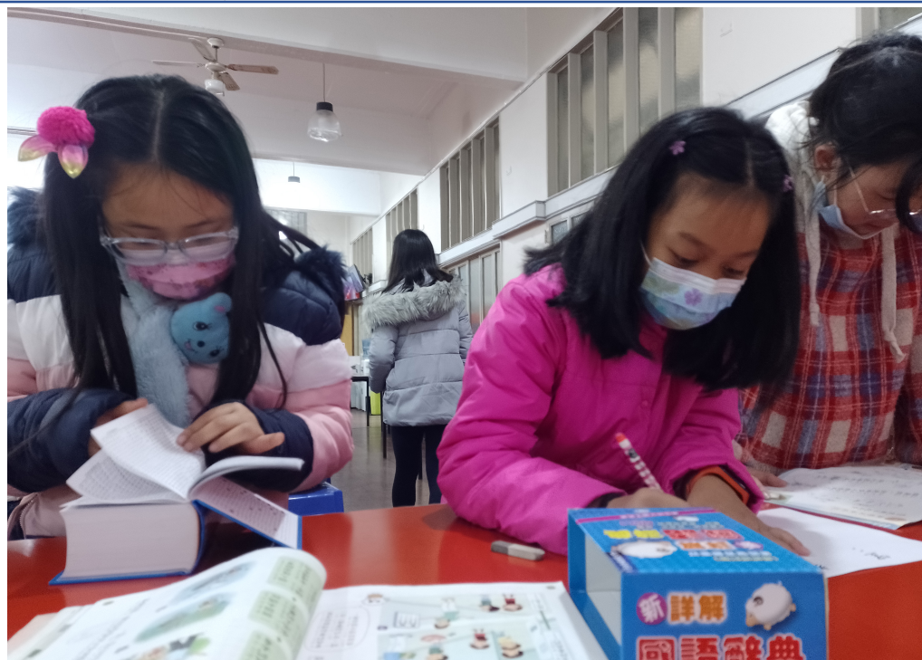
2022學年度愛育學校 「正體漢字文化節國語文國小中低年級組造詞比賽及 高年級組語詞接龍比賽」1