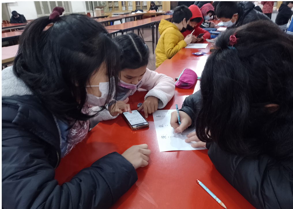
2022學年度愛育學校 「正體漢字文化節國語文國小中低年級組造詞比賽及 高年級組語詞接龍比賽」 5