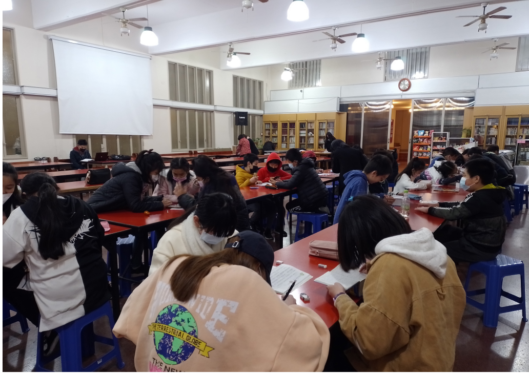
2022學年度愛育學校 「正體漢字文化節國語文國小中低年級組造詞比賽及 高年級組語詞接龍比賽」6