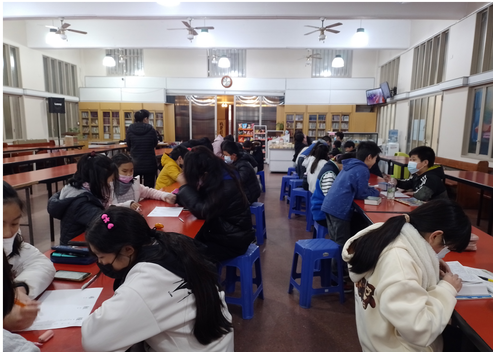
2022學年度愛育學校 「正體漢字文化節國語文國小中低年級組造詞比賽及 高年級組語詞接龍比賽」2