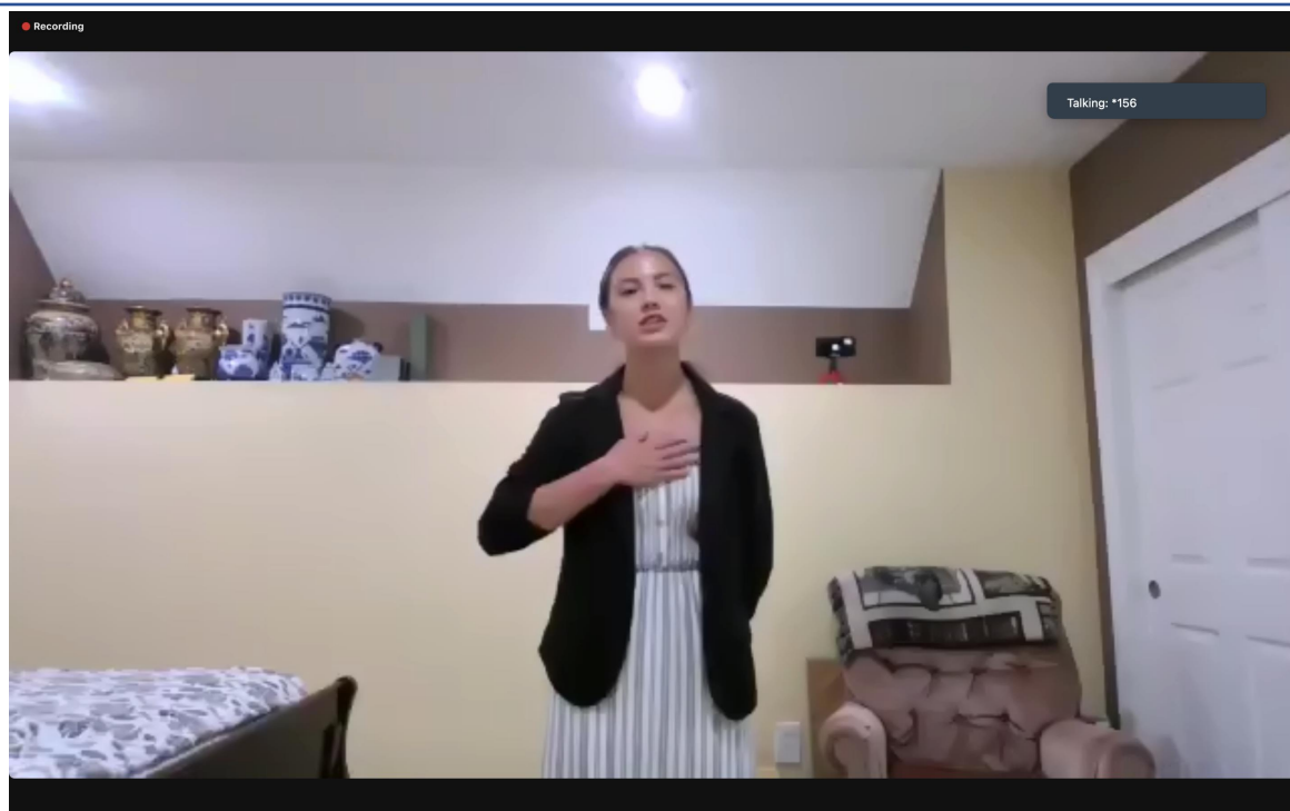
國語演講比賽學生