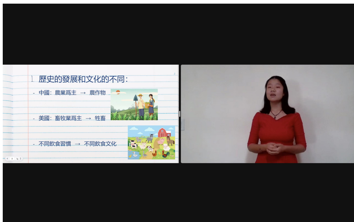
多媒體高年級單人組第一名學生 聖瑪利諾中文學校 鄭麗媛