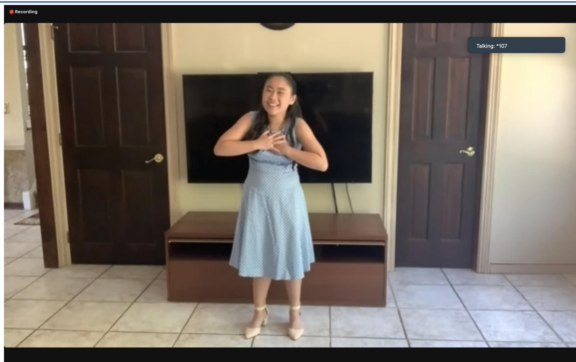
國語演講比賽學生