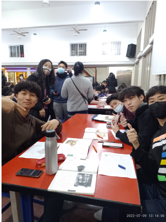
111學年度愛育學校正體漢字文化節「全校寫字比賽」3