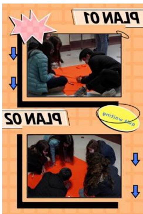
阿根廷新興中文學校國際部漢字搶答趣味競賽（繞口令）2