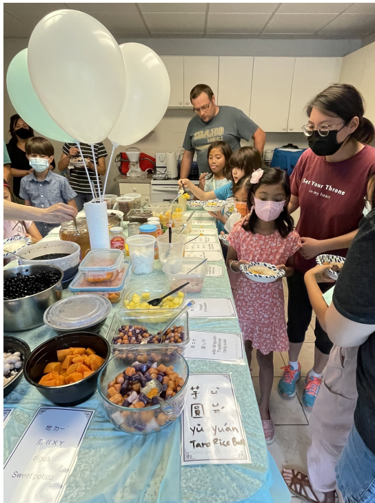
老師帶著學生一同為剉冰加上美味配料，並練習發音

我們天柏中文學校Tampa Chinese School 特別製作了剉冰配料中文讀卡，我們分別用：『中文』、『注音』、『拼音』、『英文』等，讓小朋友唸出中文的配料名稱才可以享受剉冰。