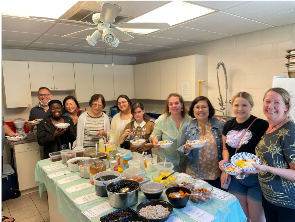
臺灣華語文學習中心學員享受臺灣小吃「剉冰」