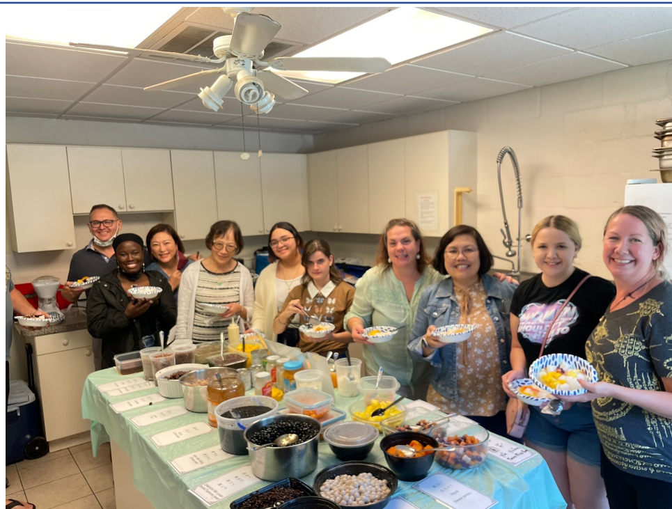
臺灣華語文學習中心學員享受臺灣小吃「剉冰」