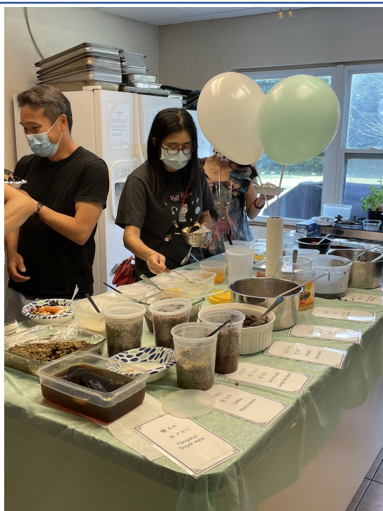
家長們也一同享用美味剉冰