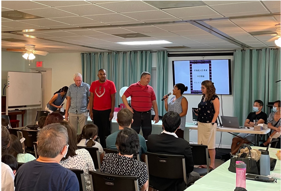
臺灣華語文學習中心學員表演基礎對話練習及中文歌曲「朋友」