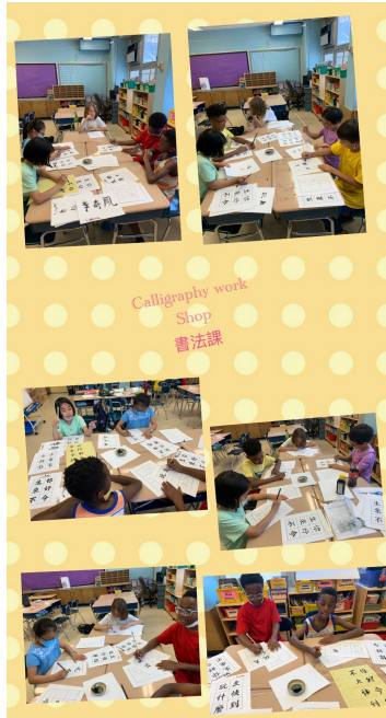
展望中美國際學校2022漢字文化-紐約市學生中文書法比賽2