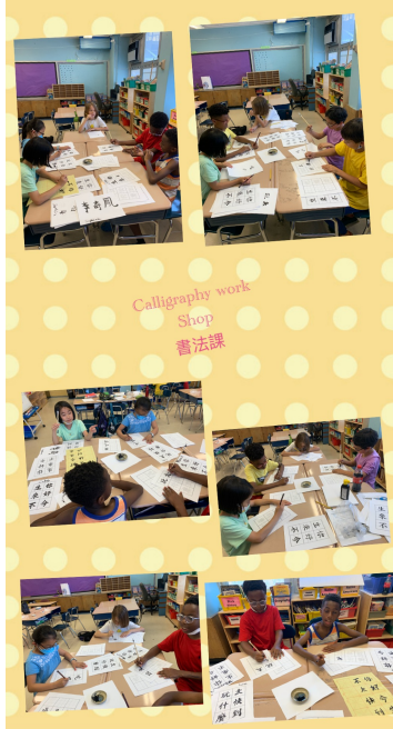
展望中美國際學校2022漢字文化-紐約市學生中文書法比賽2