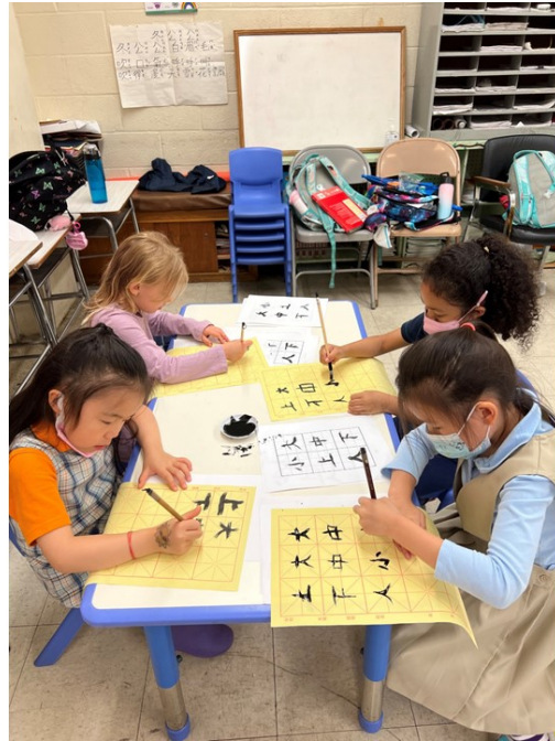
展望中美國際學校2022漢字文化-紐約市學生中文書法比賽3