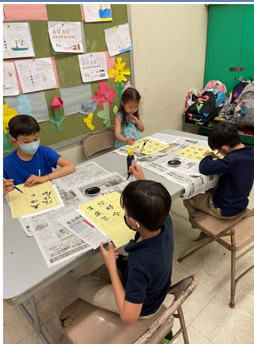
展望中美國際學校2022漢字文化-紐約市學生中文書法比賽4