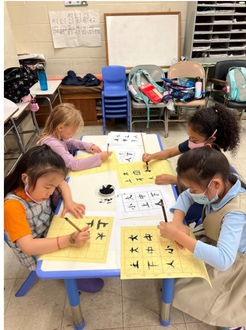
展望中美國際學校2022漢字文化-紐約市學生中文書法比賽3