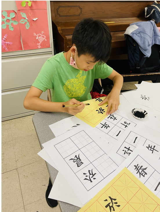
展望中美國際學校2022漢字文化-紐約市學生中文書法比賽5