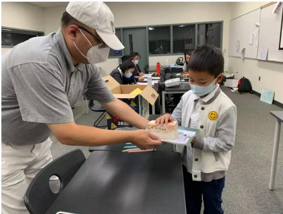
參與海外正體漢字文化節比賽的學生都得到一份獎狀和獎品。

另一位家長說：「小孩子都很期待這樣的比賽，因為這是一個很好的機會，讓他們用很短的時間去想到應該說出來的字，可以增加他們對中文字的認識；希望慈濟人文學校能持續辦理這樣的活動。」