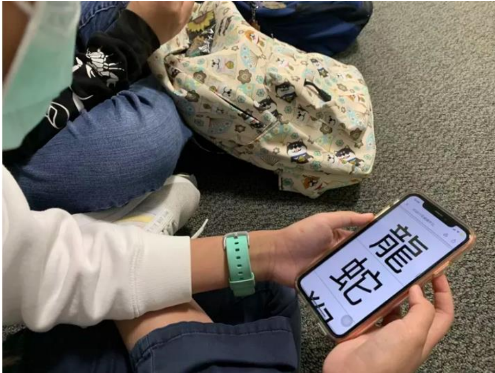
識字比賽前，學生使用手機複習中文字也很方便。