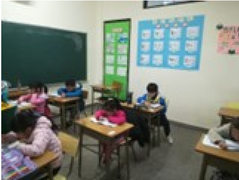
新興中文學校小學低年級2022重組句子競賽2