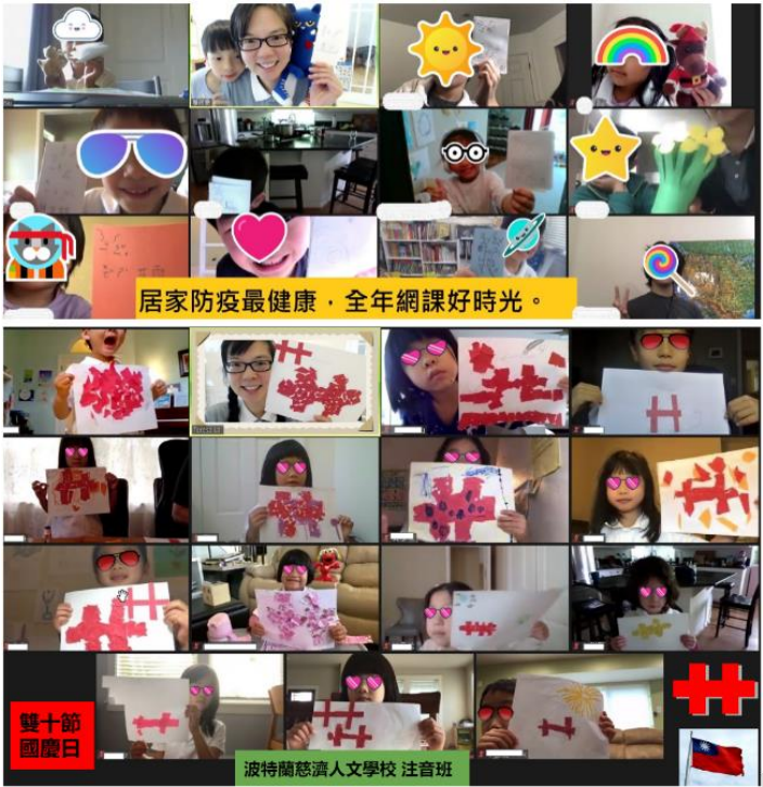
疫情下的網課好時光