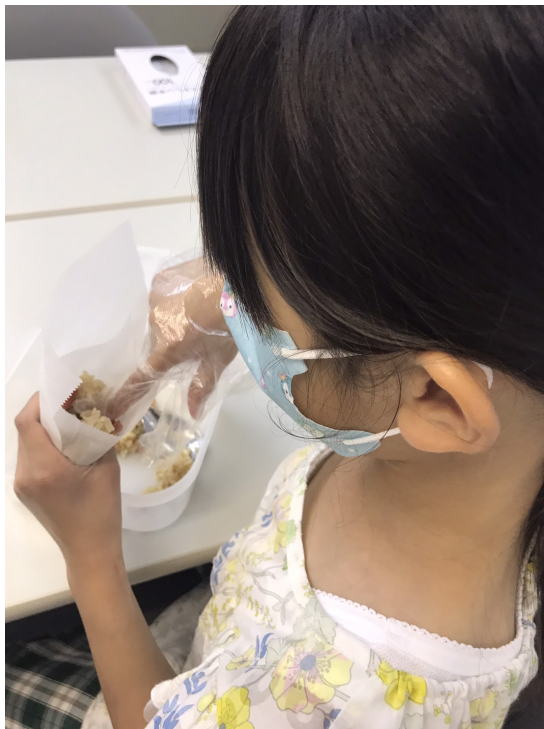
用矽油紙來整形粽子

6月4日這一天為慶祝一年一度端午節（6月3日）的到來，老師引領著幼幼班的小朋友及小學生班的大姐姐們分別制作了端午節的應景活動。幼幼班的小朋友利用畫筆及各式各樣的材質的紙條做成了五顏六色的噴火龍，而大姐姐班的學員則是第一次用真的粽葉完成了粽子，由於粽子的三角型對於第一次包的學員來說仍有難度，老師運用了矽油紙讓大家先將形狀整型好後再放在粽葉裡包起來，讓每月學員都能得心應手的完成。事後大家吃著粽葉的同時，也感受到這個對華人來說非常重要的節慶。