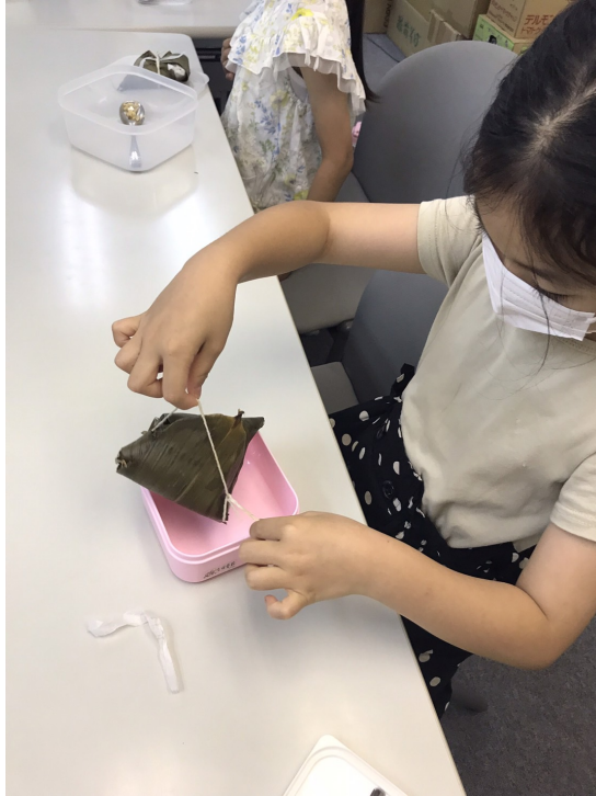
品嚐自己做的粽子